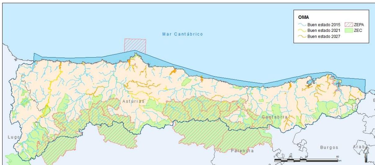
Figura 2. Objetivos medioambientales de las masas de agua superficial y Red Natura 2000