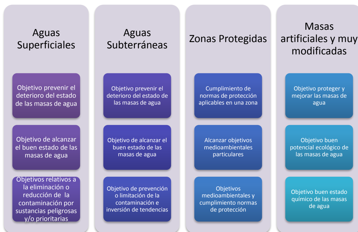
Figura 03. Objetivos medioambientales.

Para conseguir una adecuada protección de las aguas, la DMA y el TRLA establecen que se deberán alcanzar los siguientes objetivos medioambientales: