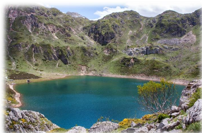
Uno de los Lagos de Somiedo

Finalmente, el Pigüeña pasa por San Cristobal y San Martín de Lodón donde se une al Narcea, tributario a su vez del Nalón.