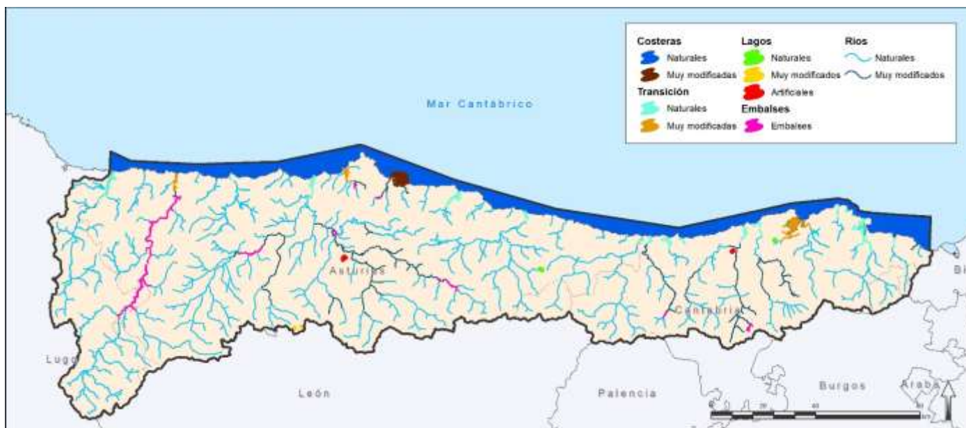
Figura 5. Mapa de masas de agua artificiales y muy modificadas según la identificación preliminar, antes de verificación