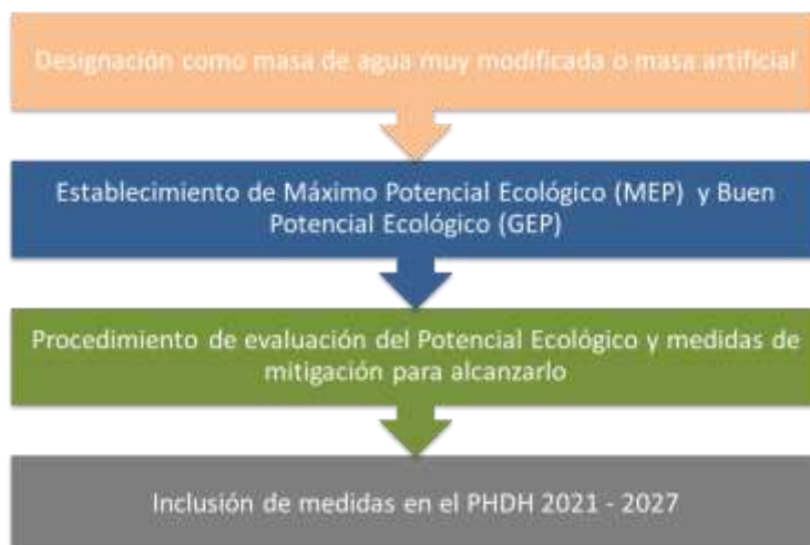
Figura 2. Esquema de aspectos a definir como consecuencia de la designación de una masa de agua artificial o una masa de agua muy modificada