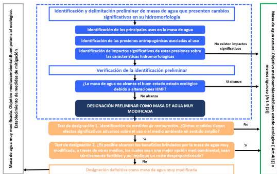
Figura 1. Esquema del proceso de designación de masas de agua muy modificadas.