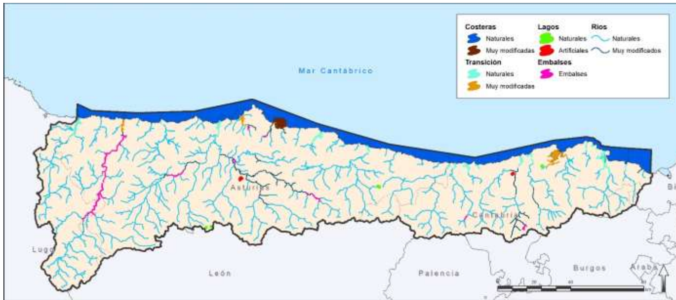
Figura 6. Mapa de masas de agua artificiales, muy modificadas y naturales según la designación definitiva