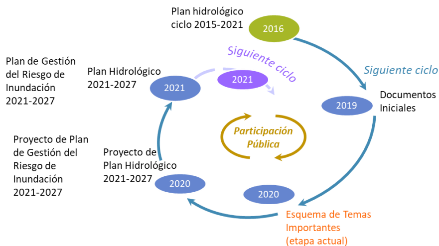
Figura 1. Proceso de planificación hidrológica.

El principal instrumento para la consecución de estos objetivos son los planes hidrológicos, en los que se recogen las medidas concretas y las correspondientes disposiciones normativas para alcanzarlos. En este contexto, el Plan Hidrológico del segundo ciclo (2015-2021) en la Demarcación Hidrográfica del Cantábrico Oriental fue aprobado mediante el Real Decreto 1/2016 , de 8 de enero. En la actualidad, las Administraciones Hidráulicas, Confederación Hidrográfica del Cantábrico y Agencia Vasca del Agua, ya han comenzado el nuevo proceso de revisión del Plan , que debe concluir antes de diciembre de 2021 y consta de las etapas que se muestran a continuación.