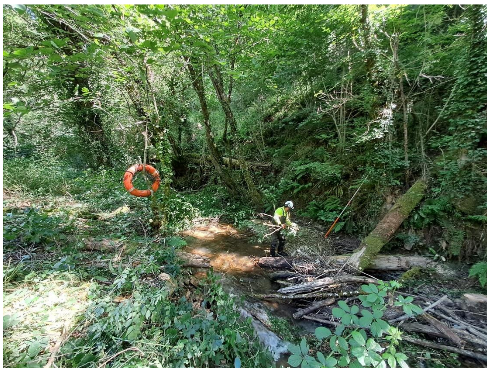
Durante los trabajos