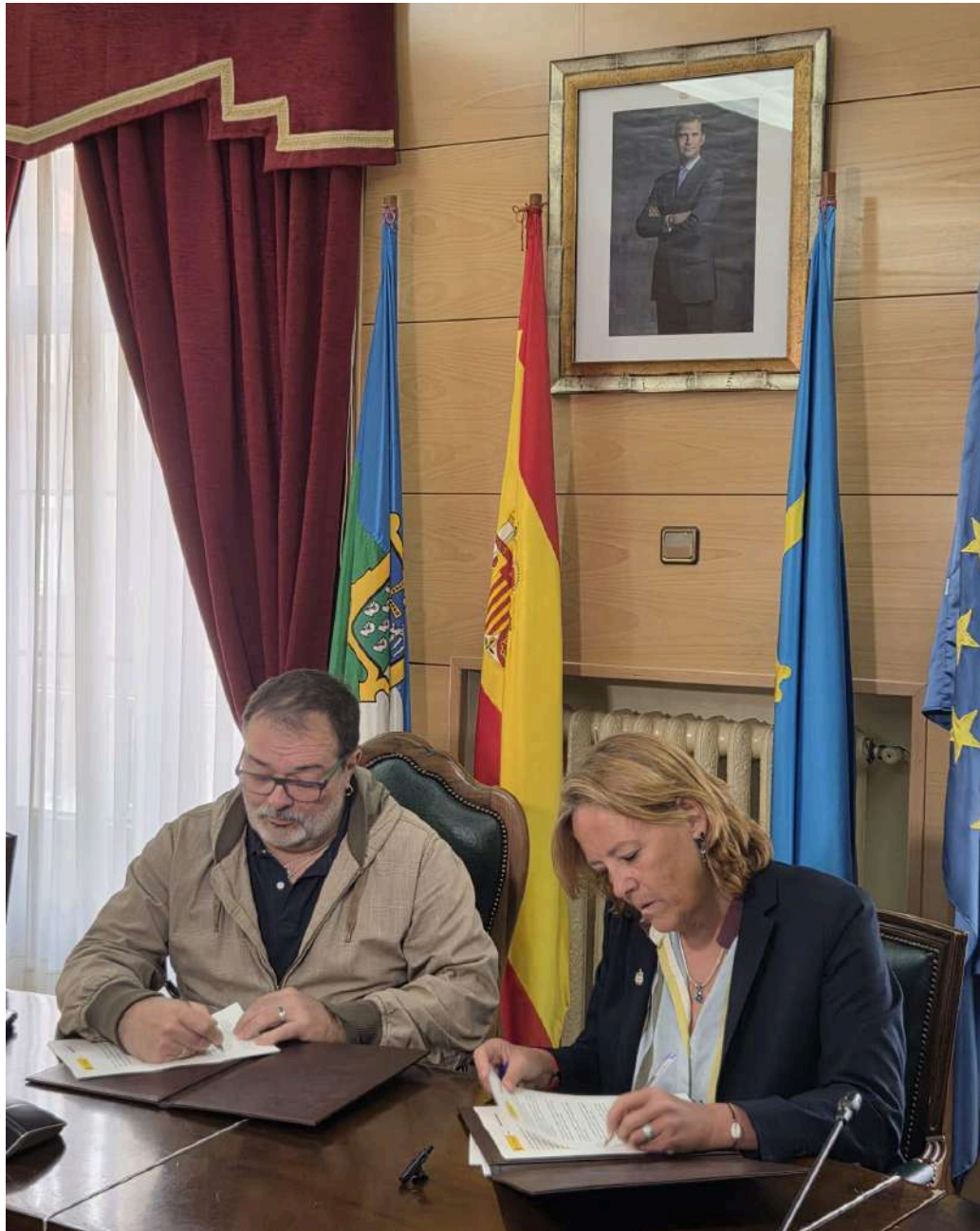
Firma del convenio de colaboración