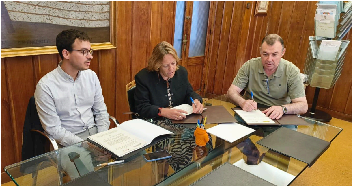
Firma del Convenio