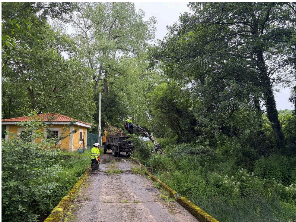
Durante los trabajos en el río Nora en Castañera