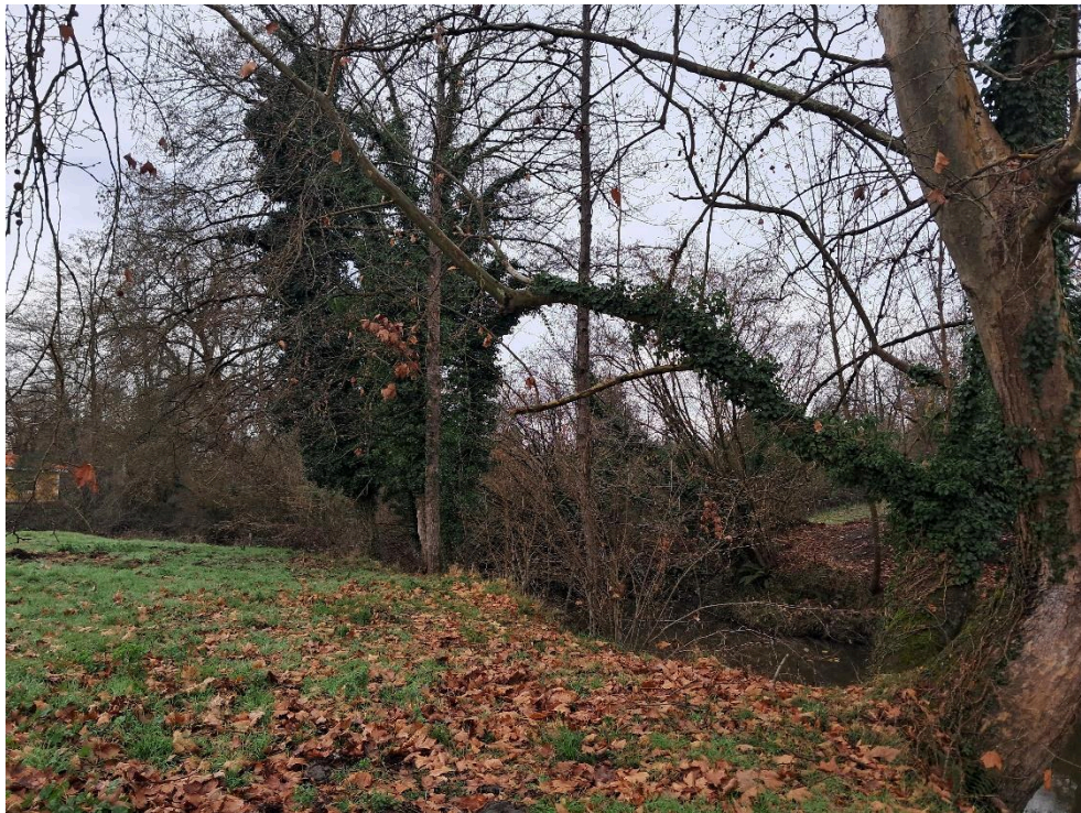
Antes de los trabajos en el río Nora en Castañera