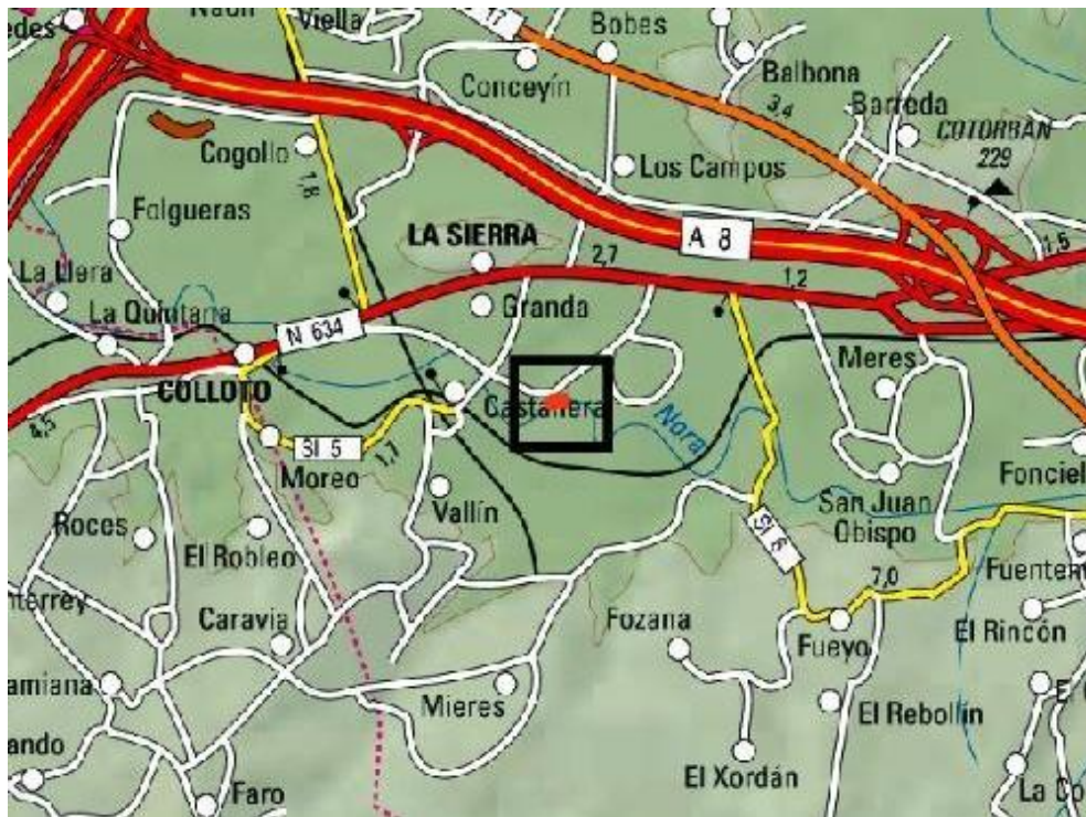
Localización de la actuación en el río Nora en Castañera

Estas actuaciones contribuyen a la mejora del estado ecológico de los ríos y se enmarcan dentro de los objetivos de la planificación hidrológica y la gestión del riesgo de inundación.