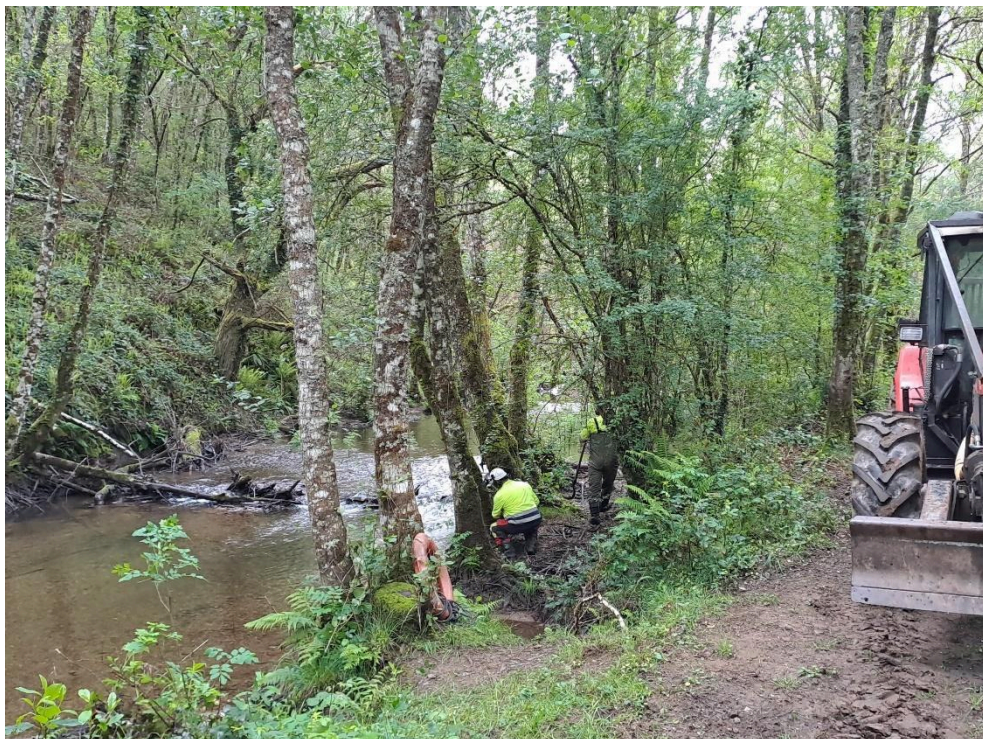
Durante los trabajos