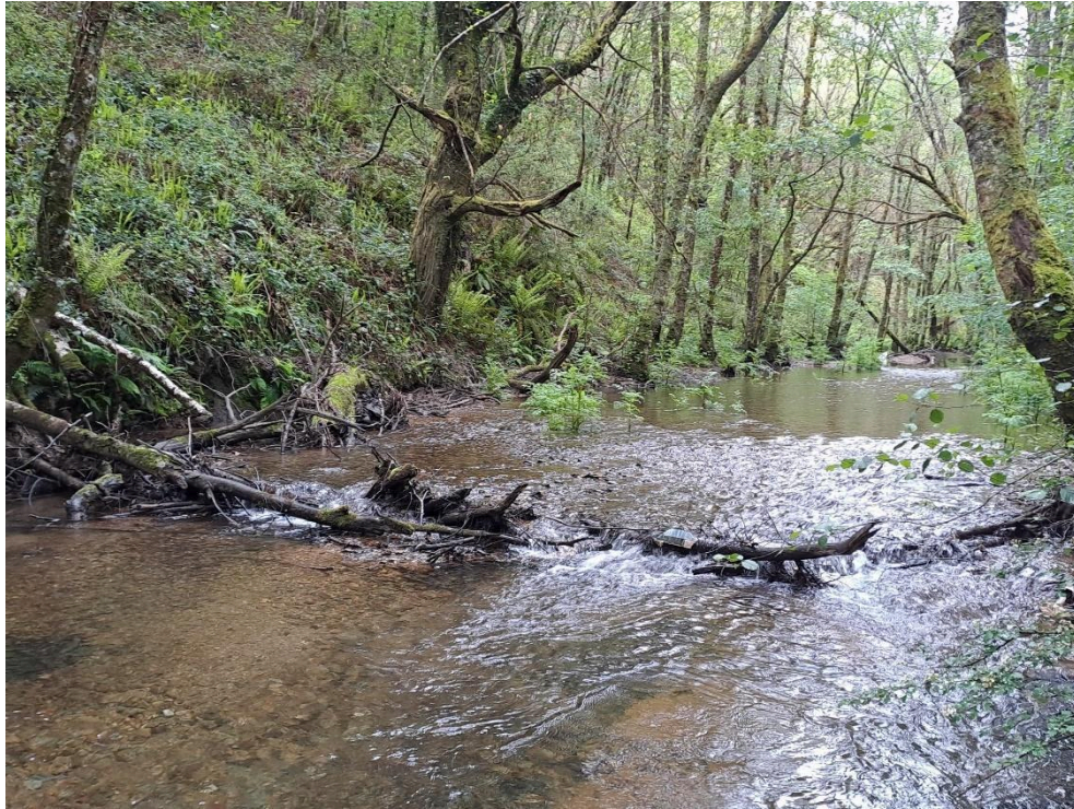
Antes de los trabajos