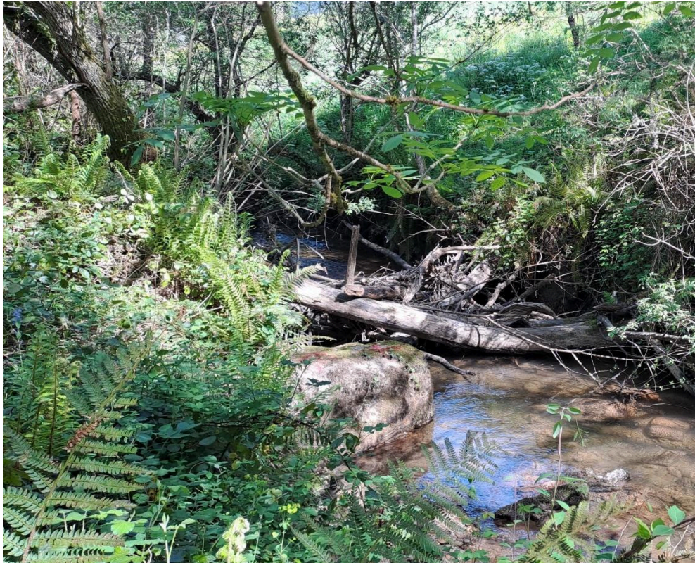
Antes de los trabajos