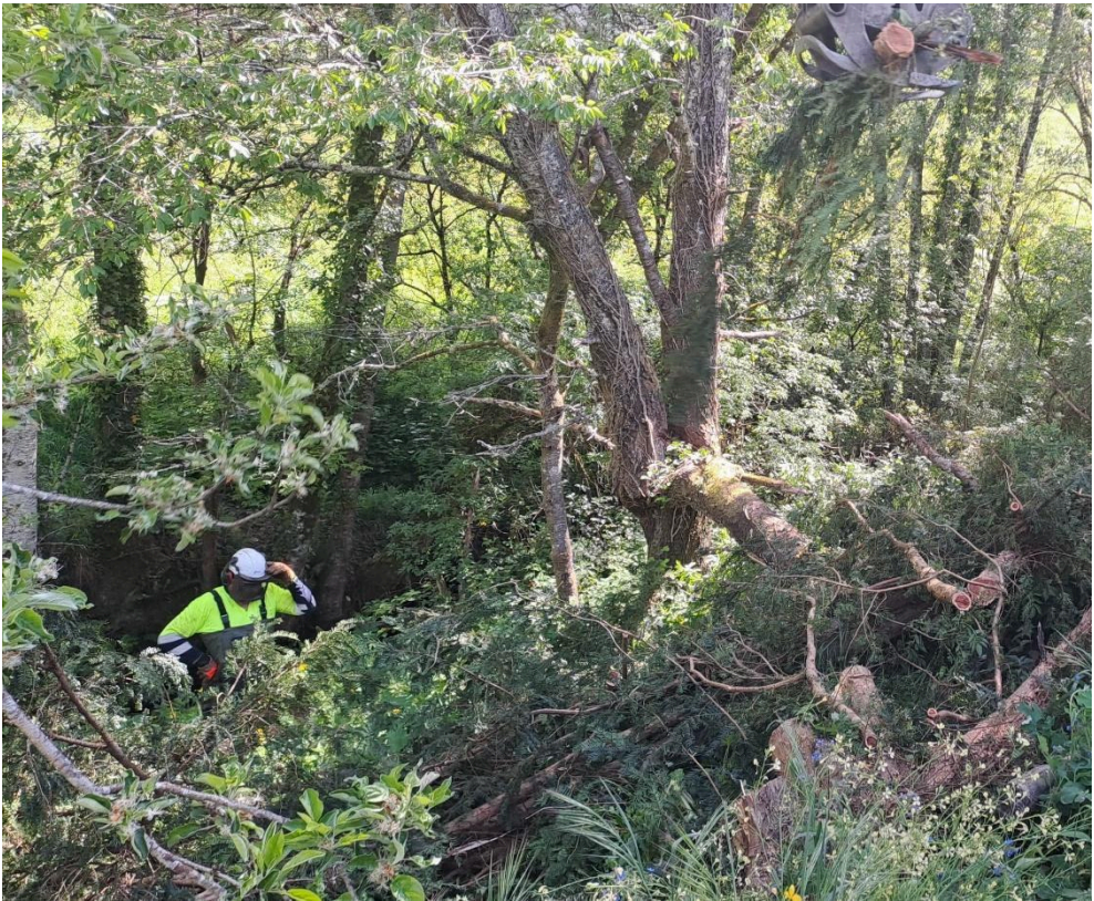
Durante los trabajos