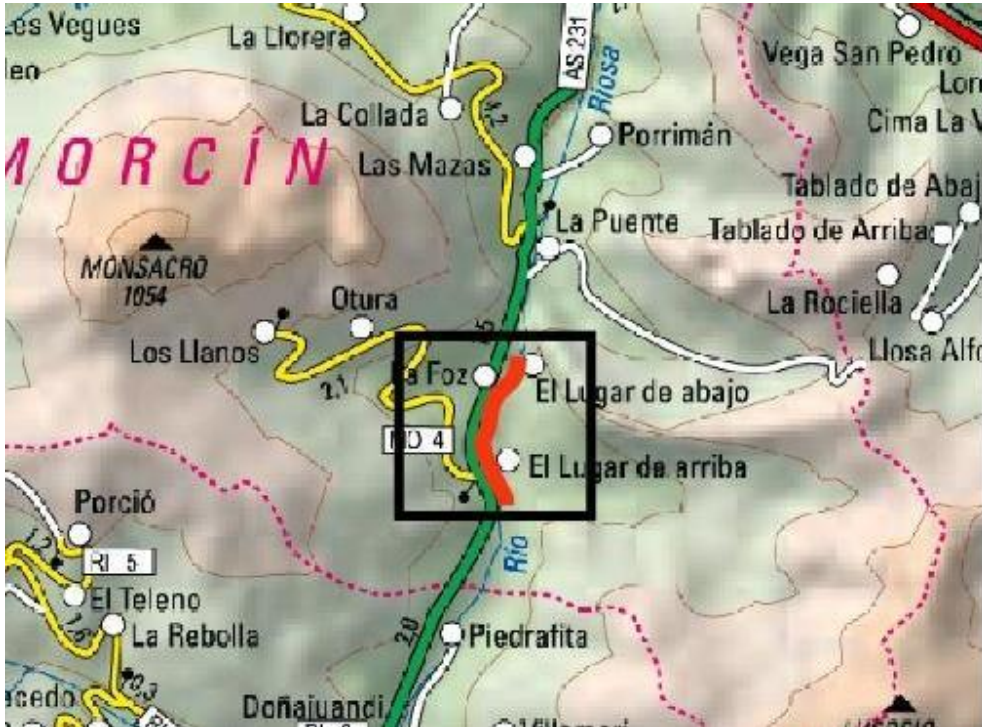
Localización de la actuación en el río Riosa en La Foz

En el año 2025, la Confederación Hidrográfica del Cantábrico destinó 5,9 millones de euros a trabajos de conservación y mantenimiento de cauces en 263 actuaciones distribuidas por 100 municipios.