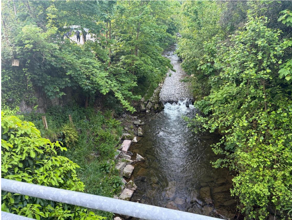
Antes de los trabajos