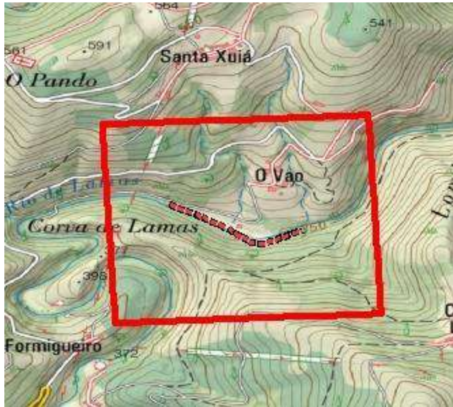
Localización de la actuación en el río Lamas en O Vao