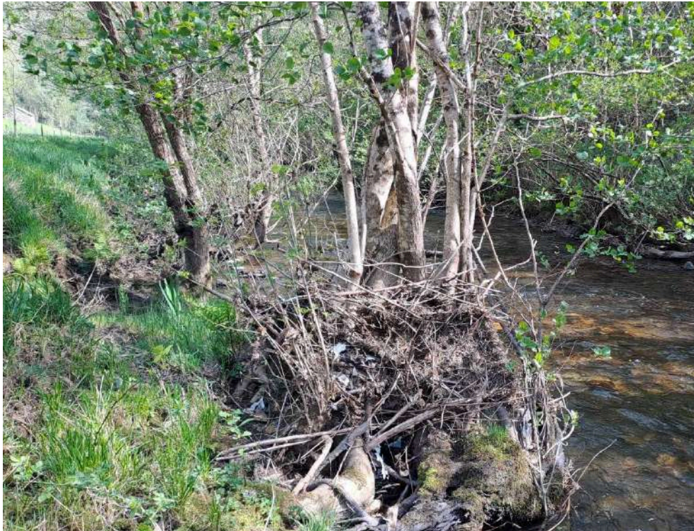
Antes de los trabajos