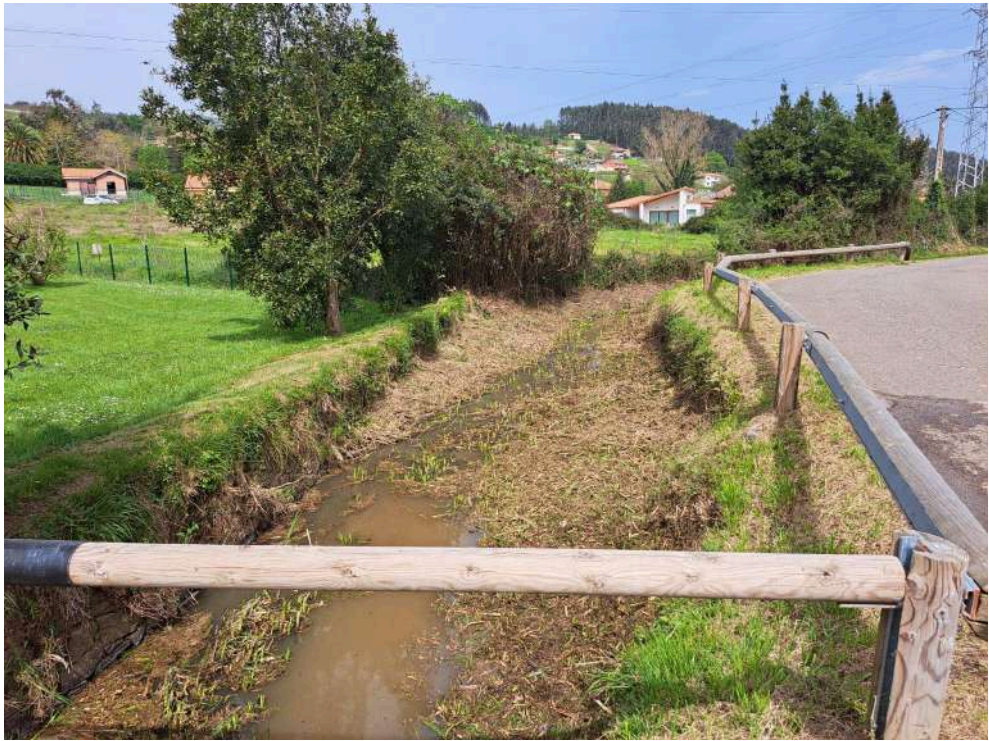
Después de los trabajos