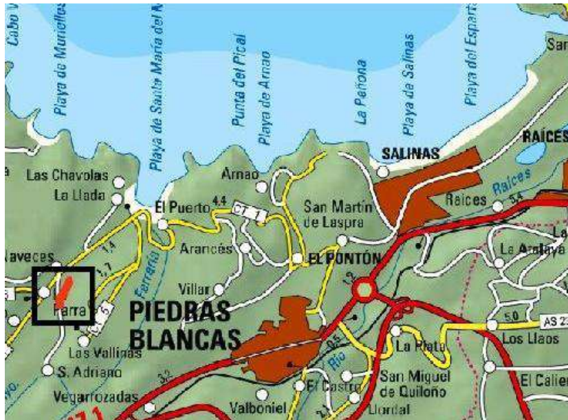
Localización de la actuación en el arroyo Fontaniella en Naveces

En el año 2025, la Confederación Hidrográfica del Cantábrico destinó 5,9 millones de euros a trabajos de conservación y mantenimiento de cauces en 263 actuaciones distribuidas por 100 municipios.