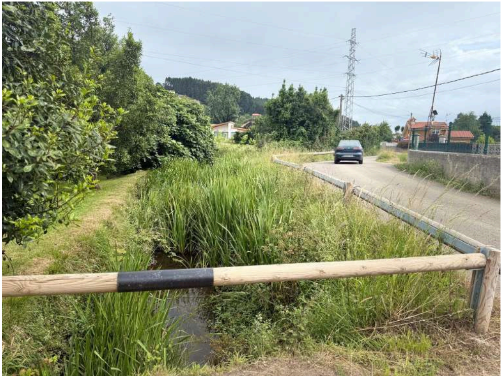
Antes de los trabajos