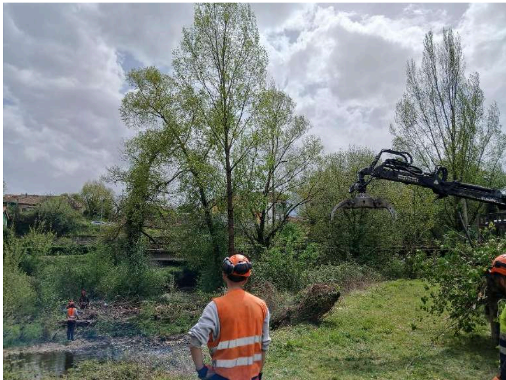
Durante los trabajos en el río Nora en Les Folgueres