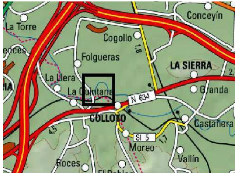
Localización de la actuación en el río Nora en Les Folgueras