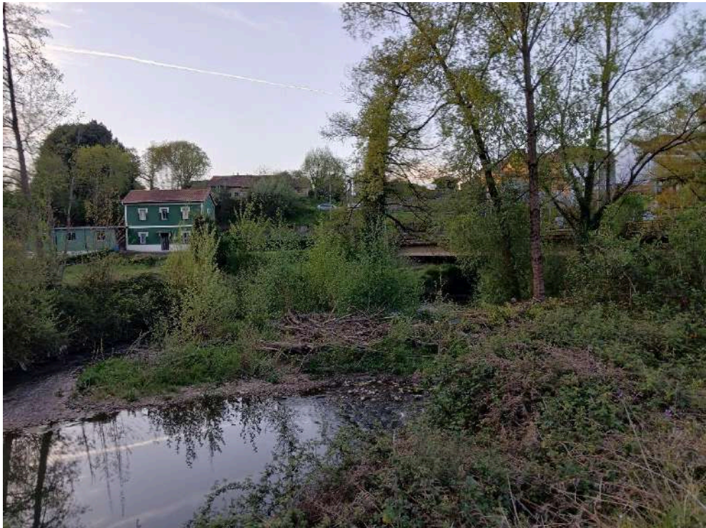
Antes de los trabajos en el río Nora en Les Folgueres