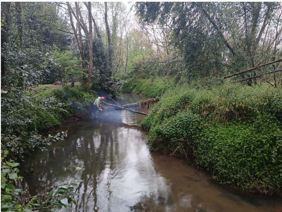
Durante los trabajos