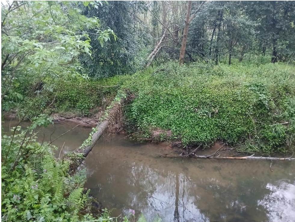
Antes de los trabajos