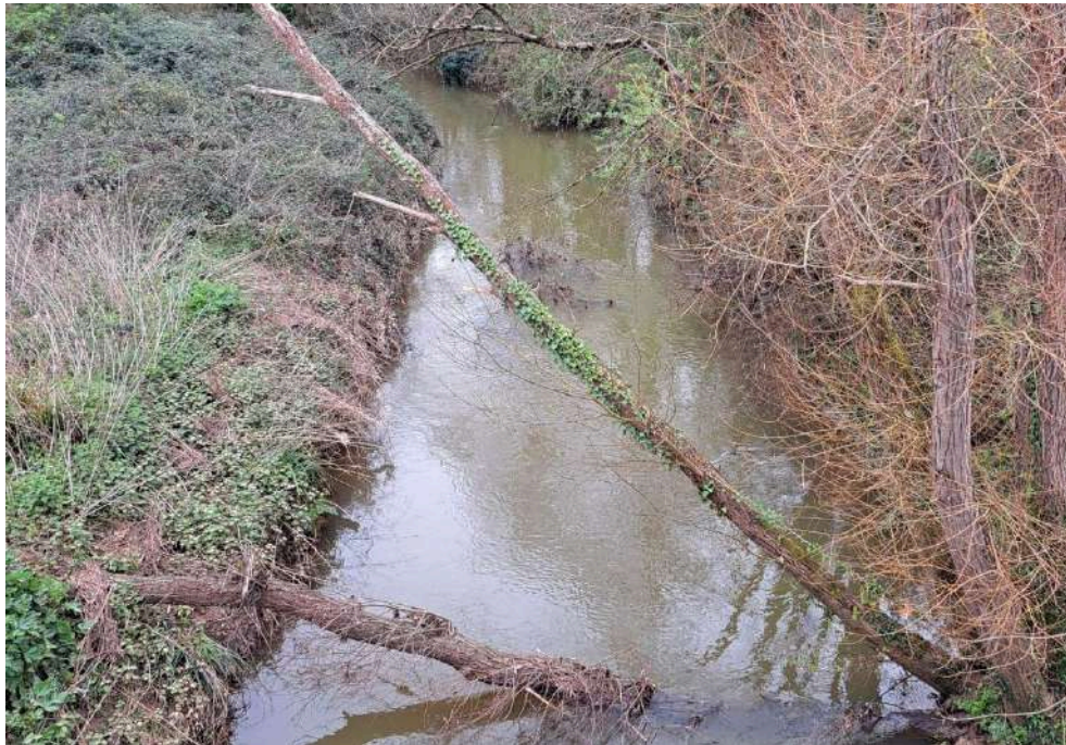
Antes de los trabajos en el río Noreña