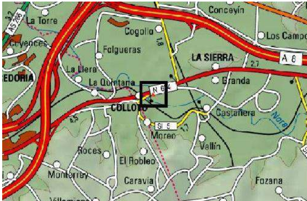
Localización de la actuación en el río Nora en Colloto

En el año 2025, la Confederación Hidrográfica del Cantábrico destinó 5,9 millones de euros a trabajos de conservación y mantenimiento de cauces en 263 actuaciones distribuidas por 100 municipios.