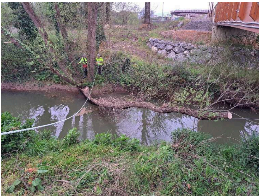
Durante los trabajos en el río Noreña