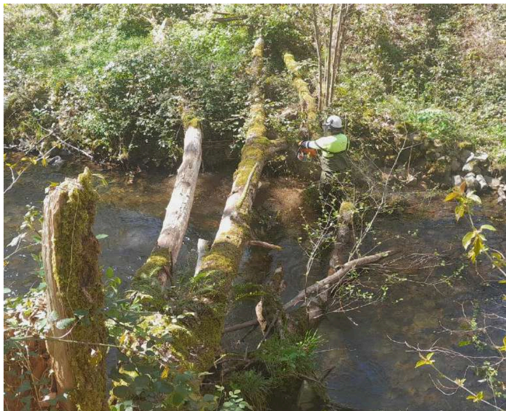
Durante los trabajos