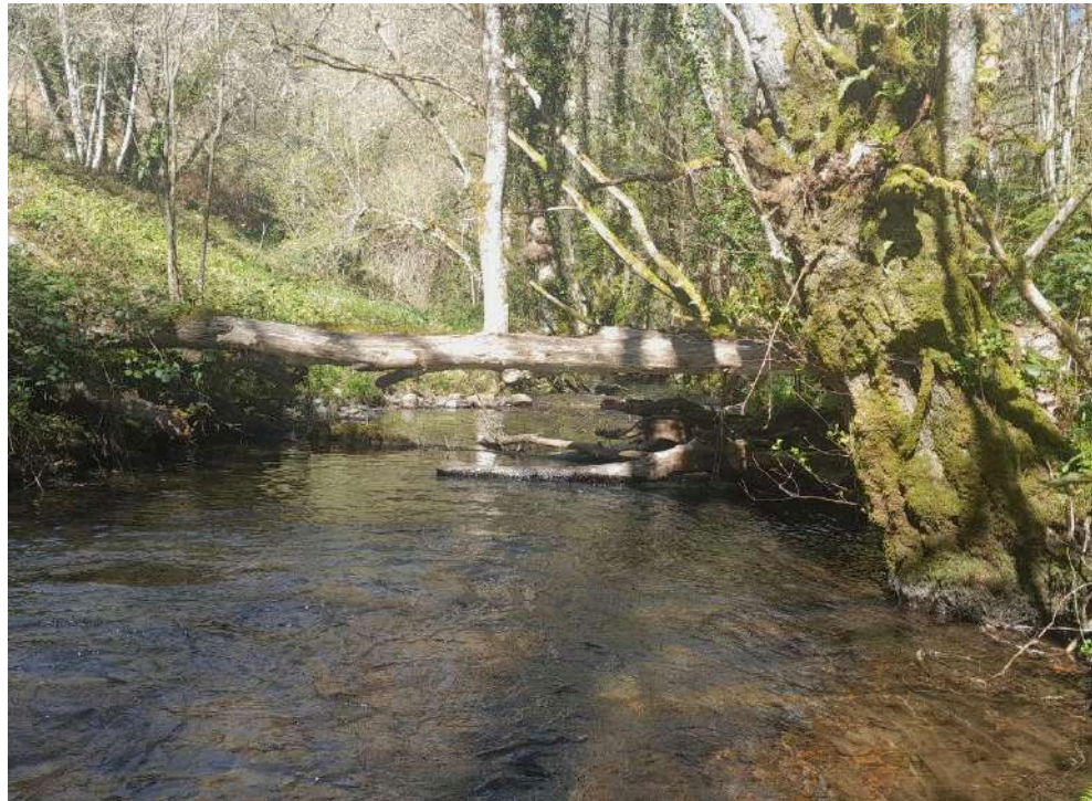
Antes de los trabajos