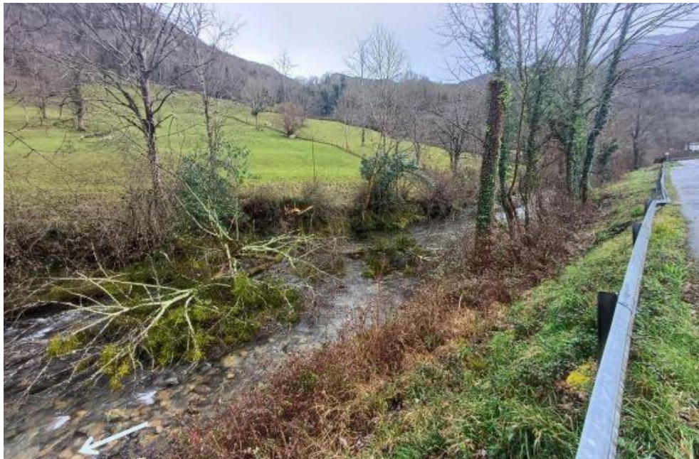
Antes de los trabajos