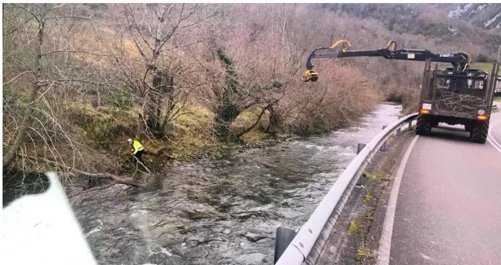
Durante los trabajos