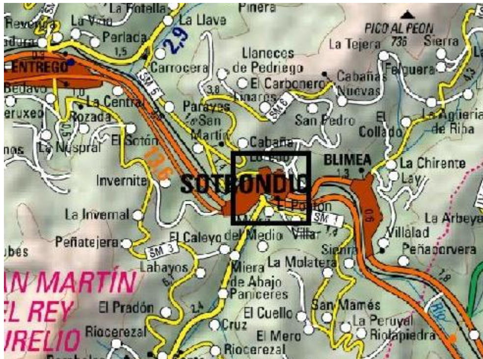
Localización de la actuación en el río Nalón en Sotrondio