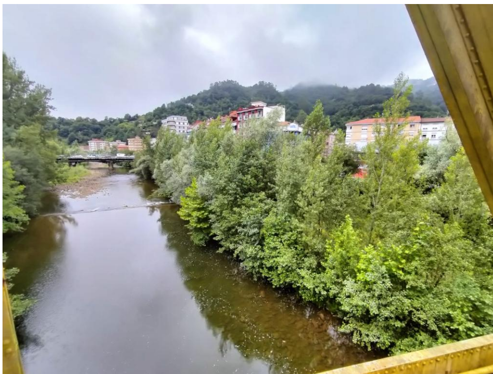
Antes de los trabajos