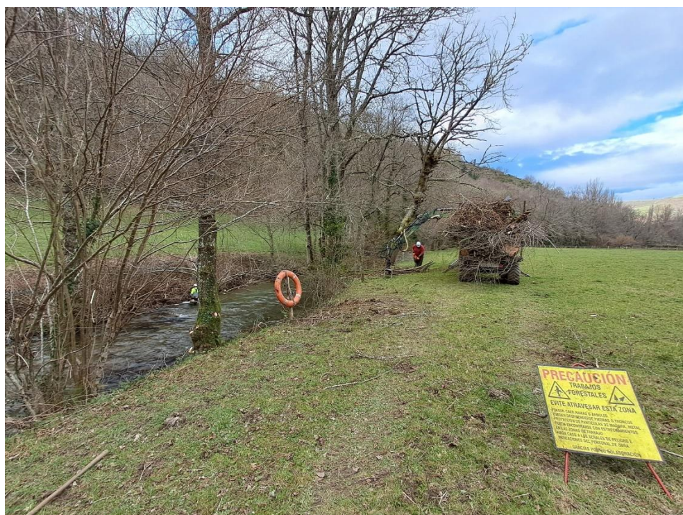
Operarios retirando restos vegetales