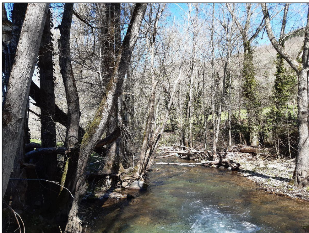
Antes de los trabajos