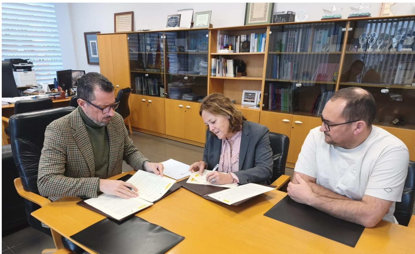
Firma del Convenio