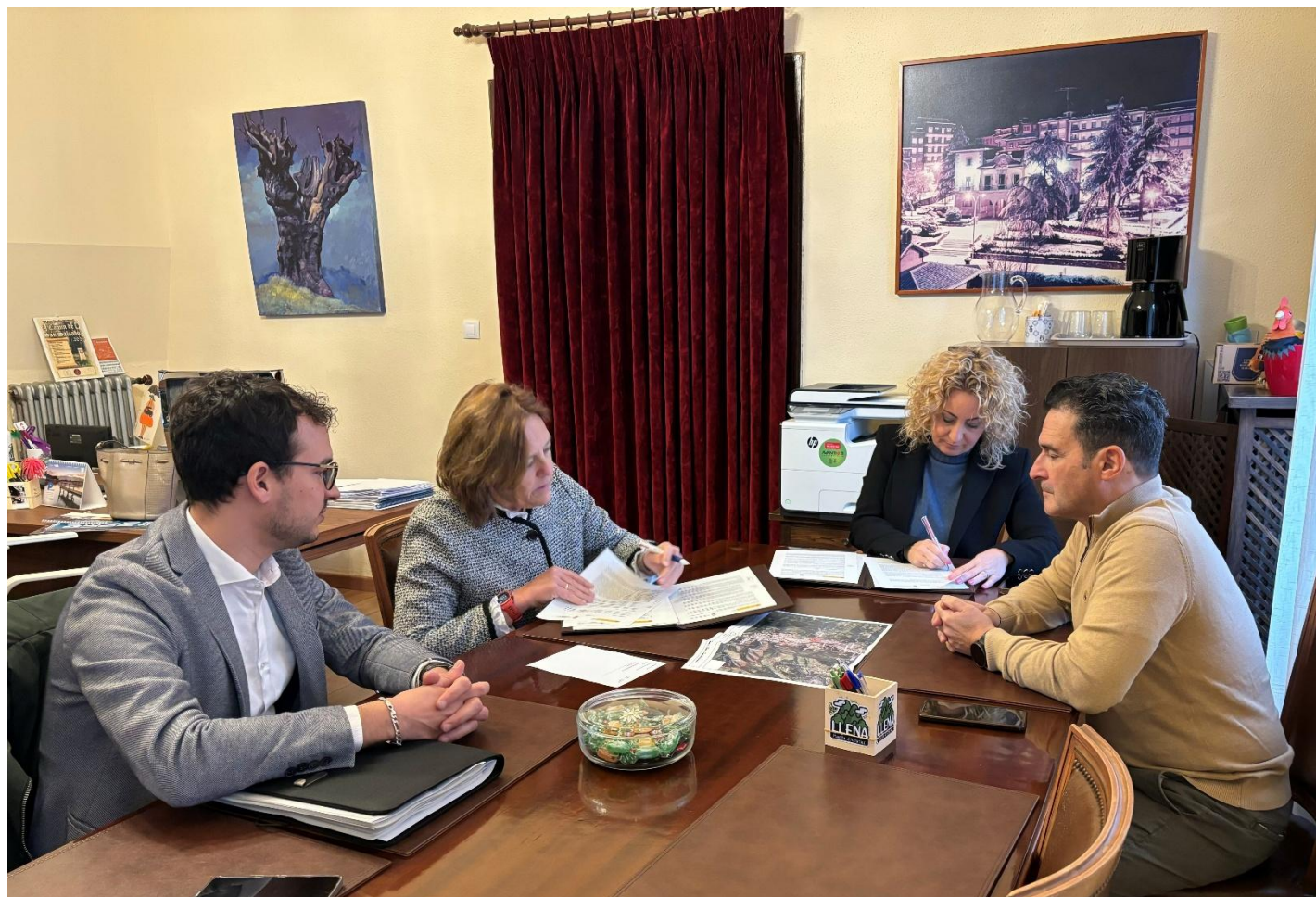
Firma del Convenio