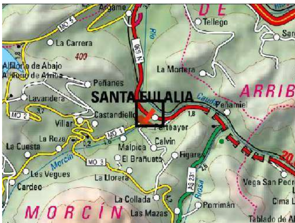
Localización de la actuación en el río Morcín en Santa Eulalia de Morcín