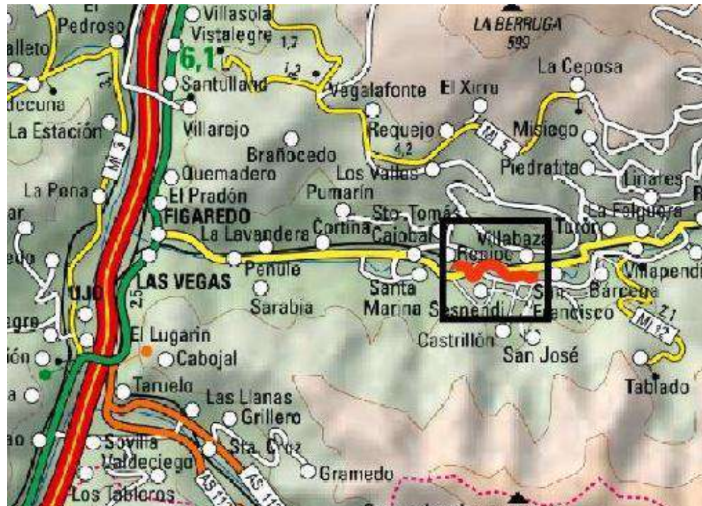
Localización de la actuación en el río Turón en La Cuadriella