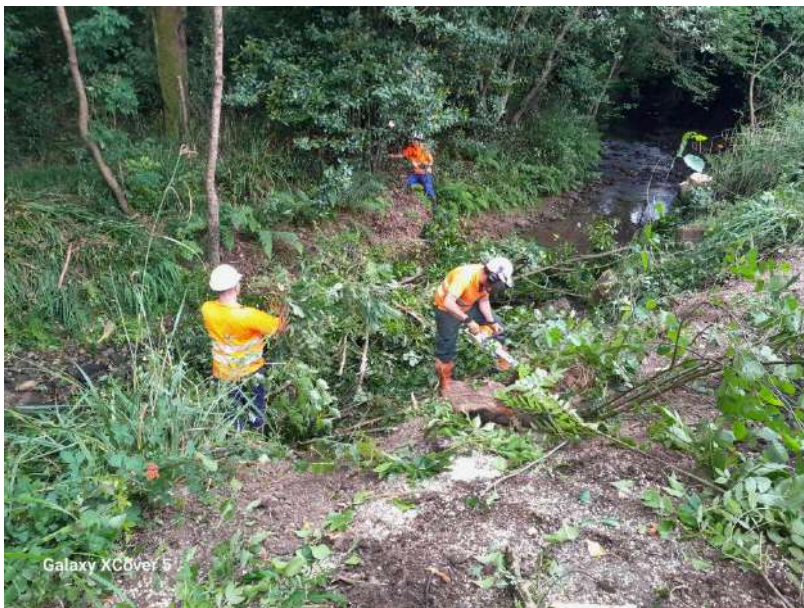
Trabajos de poda y retirada de restos vegetales con motosierra