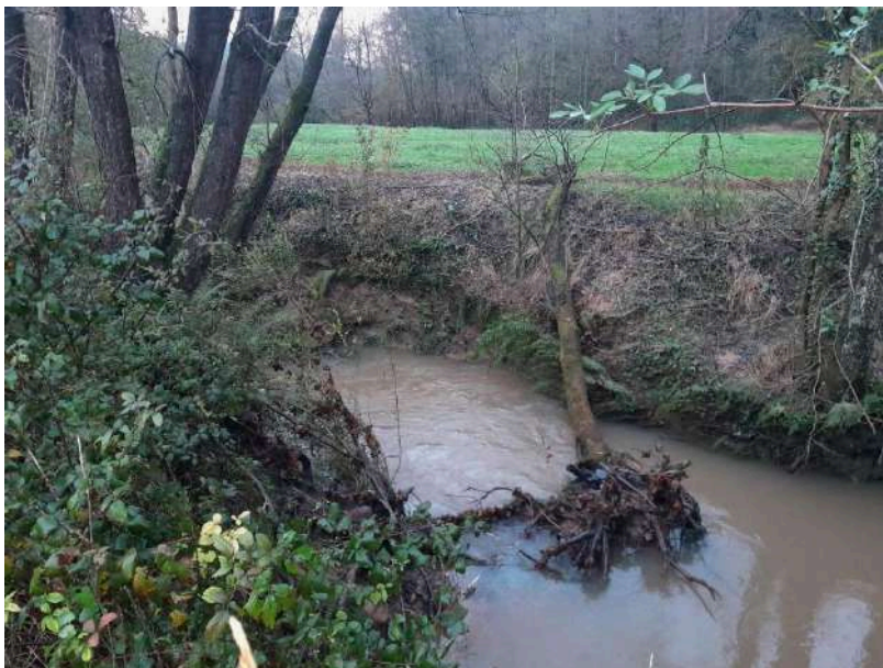
Antes de comenzar los trabajos, se observa un árbol caído en el cauce del arroyo de la Mina