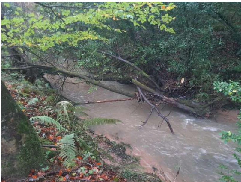
Previo a la actuación, se observan varios árboles caídos