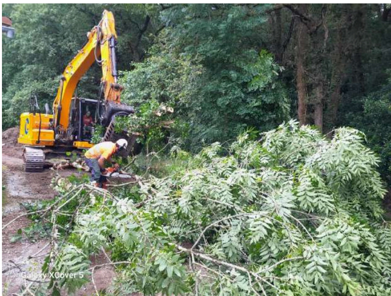
Trabajos de retirada de restos vegetales de grandes dimensiones con apoyo de retroexcavadora equipada con pinza