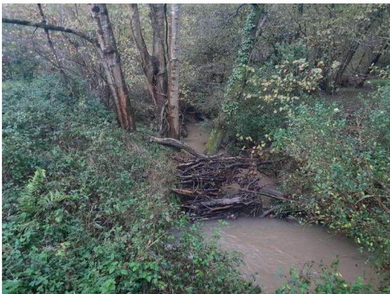
Acumulación de restos vegetales en varios puntos del arroyo que podrían generar obstrucciones