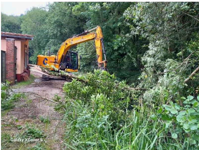
Trabajos de retirada de árbol caído en el cauce con retroexcavadora