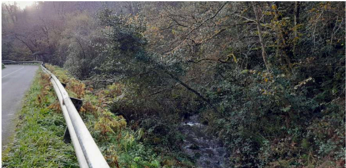
Antes de los trabajos