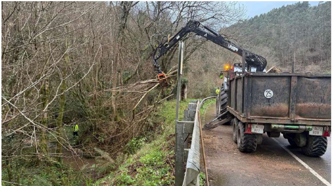
Durante los trabajos