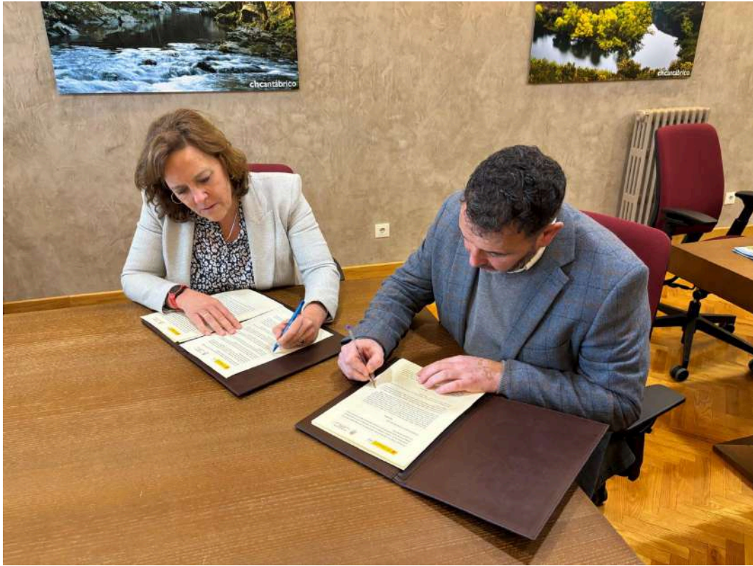
Firma del Convenio