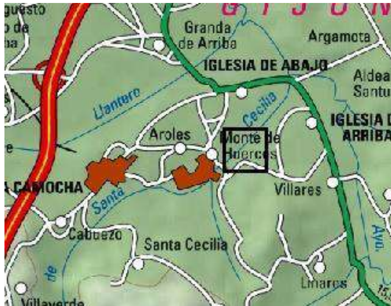
Localización de las actuaciones en el arroyo de La Vega en La Camocha