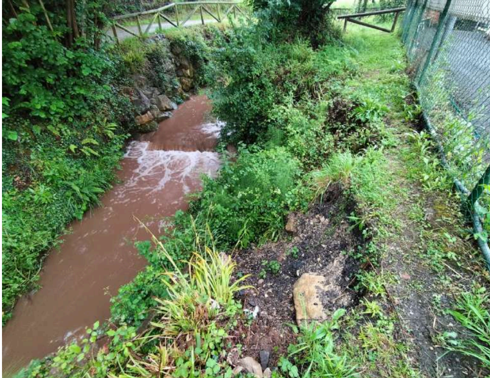
Antes de los trabajos