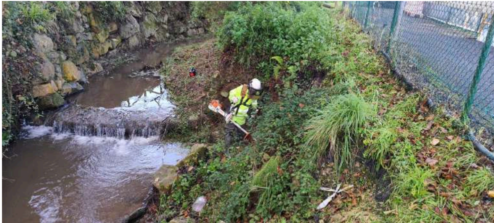
Operario desbrozando dentro del cauce