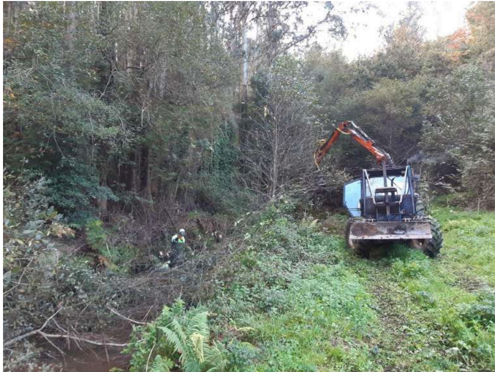
Operarios y autocargador retirando restos vegetales