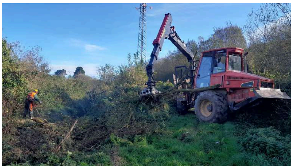
Autocargador y operario retirando restos vegetales