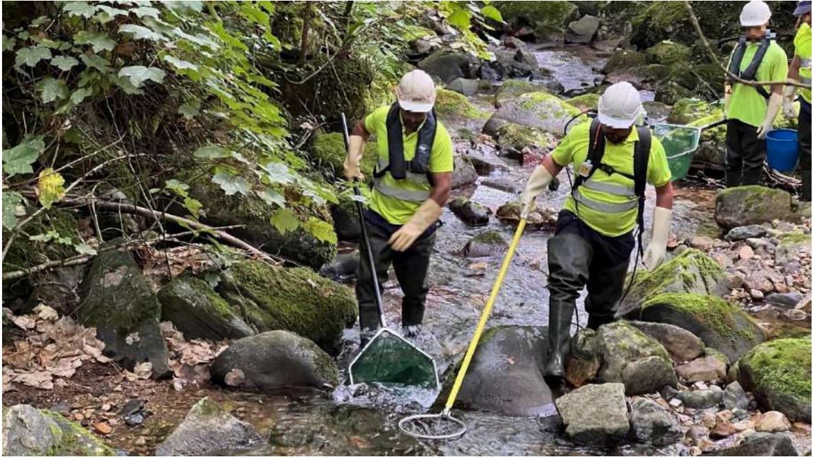
Operarios realizando pesca eléctrica