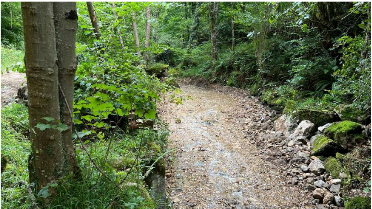
Después de los trabajos