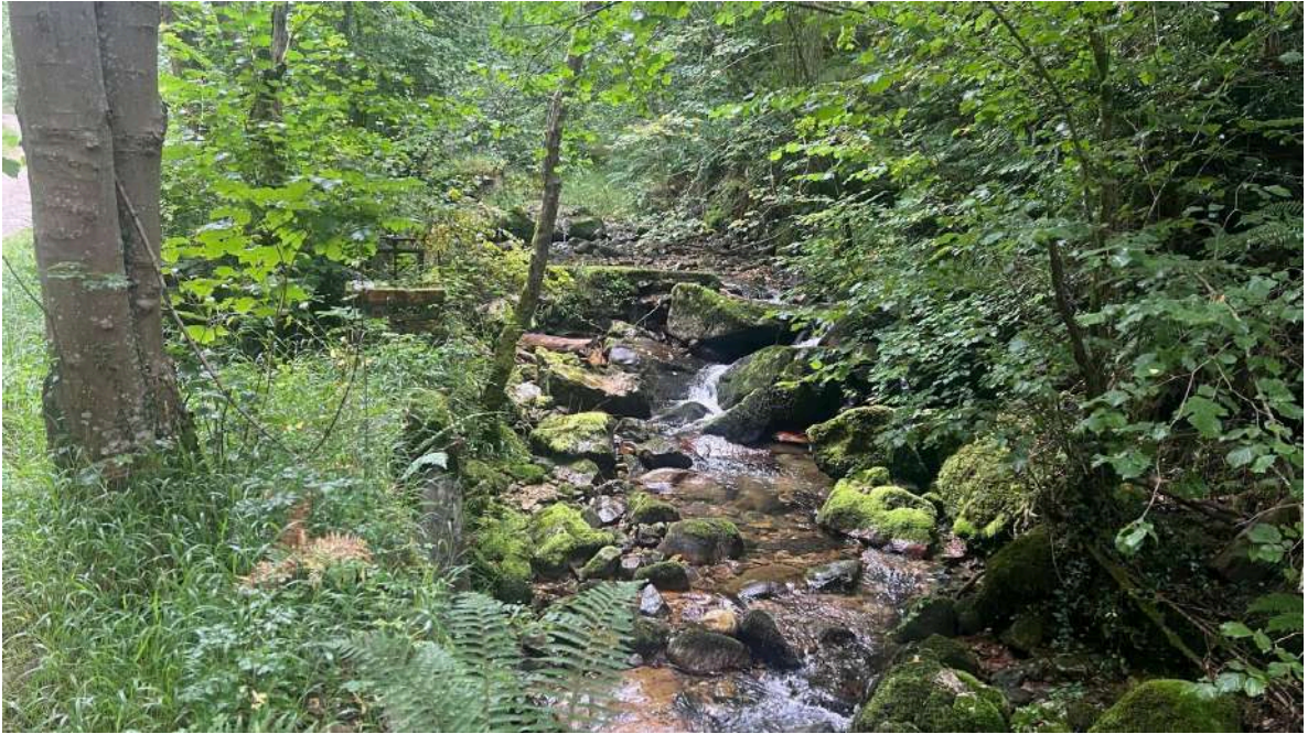
Antes de los trabajos