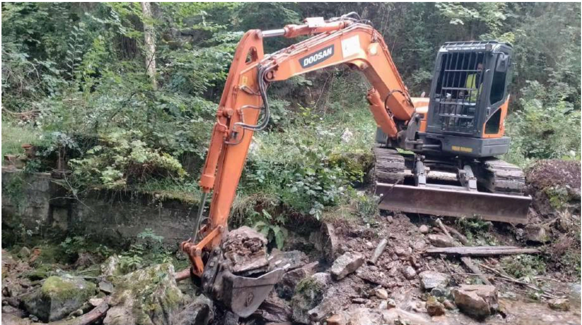
Derribo del azud