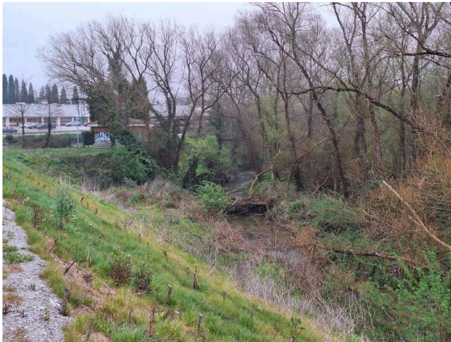
Antes de los trabajos