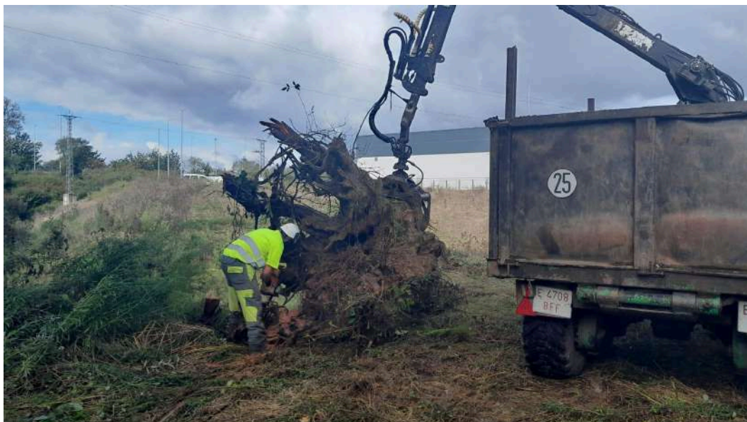
Operario y autocargador retirando raíz de gran tamaño