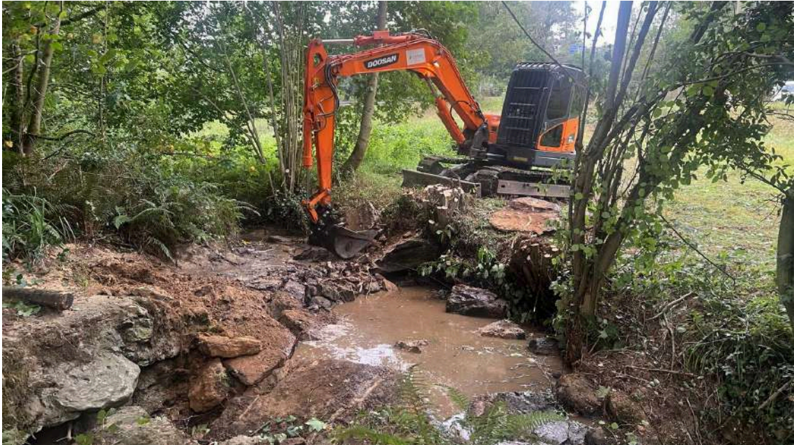
Durante de los trabajos- Mini retro demoliendo azud