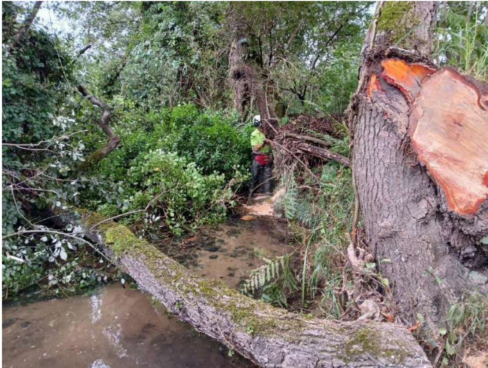
Durante los trabajos. Operario cortando árbol caído