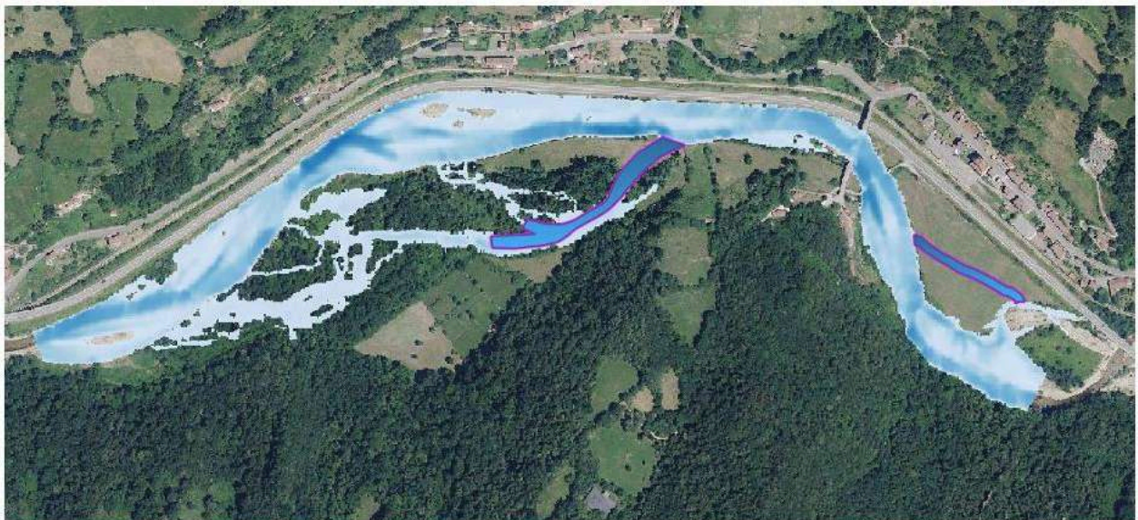
Ilustración de la máxima crecida ordinaria y de la apertura de brazos en El Llagar y Piñeres-San Antonio.

Servicios al ciudadano→Informaciones públicas y otros anuncios ( Informaciones públicas y otros anuncios (chcantabrico.es) ).