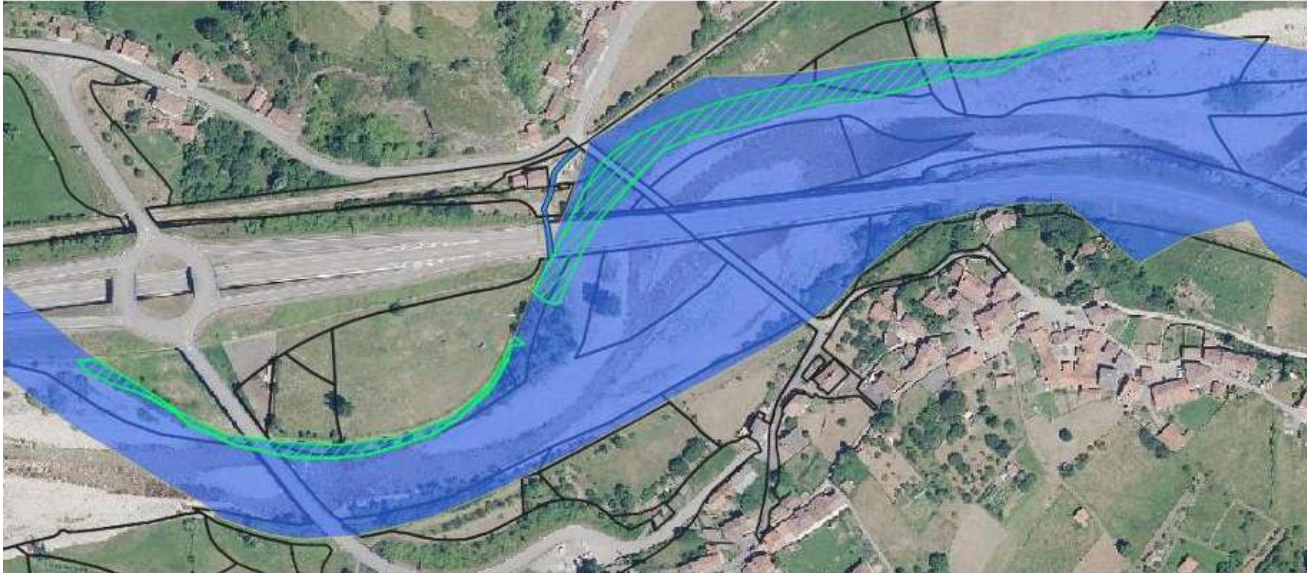
Revegetación de la margen izquierda del río Aller a su paso por Soto.