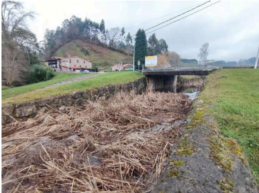
Vegetación y lodos acumulados en el canal antes de la actuación