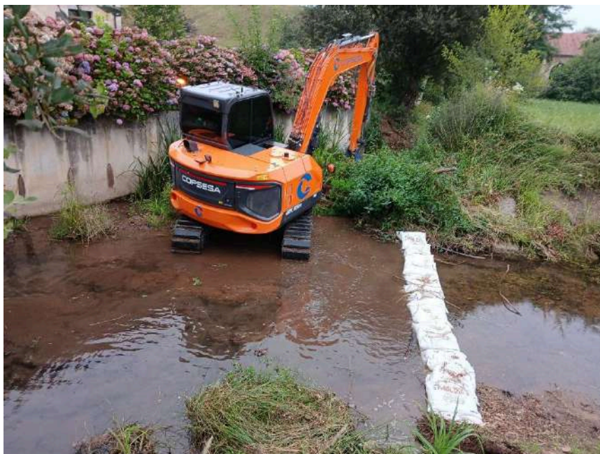
Trabajos de retirada de lodos y vegetación con maquinaria