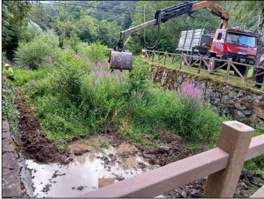
Trabajos de retirada de restos vegetales con pinza