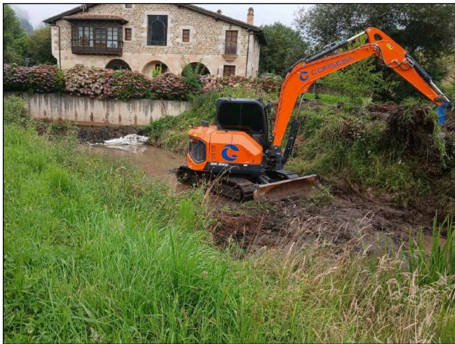
Trabajos de retirada de los lodos acumulados en el canal