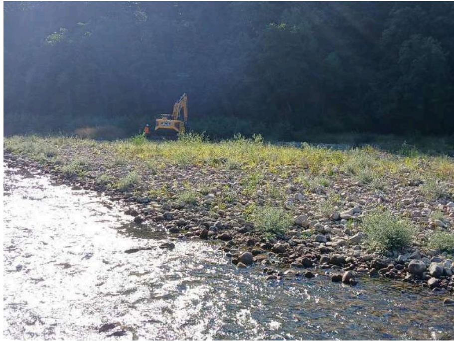
Desvío del cauce para posibilitar los trabajos en seco