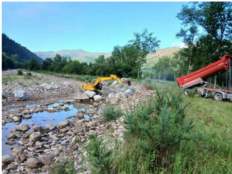
Trabajos de estabilización de la margen izquierda