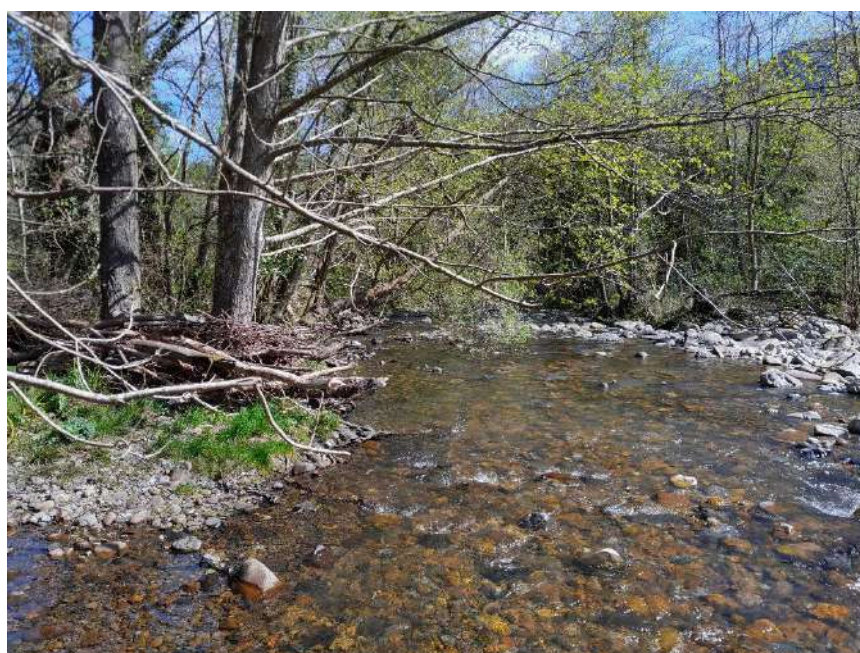
Acumulación de restos vegetales en el cauce