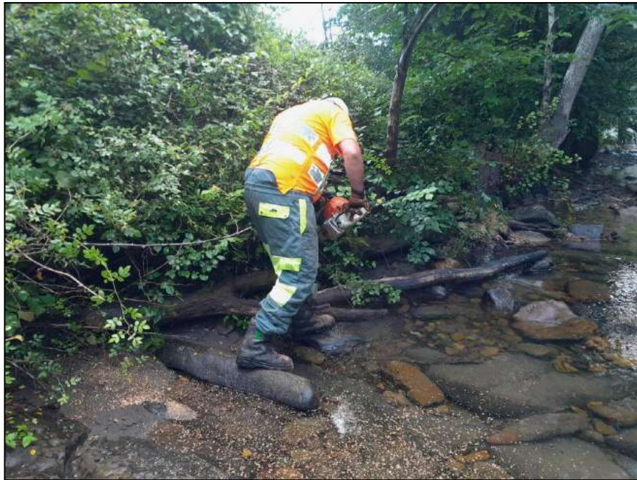
Trabajos de troceo de árbol caído en la margen del río Gándara