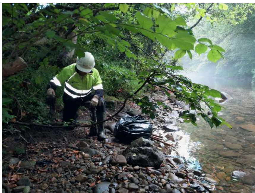
Trabajos manuales de retirada de restos antrópicos