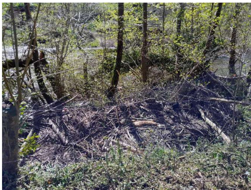
Acumulaciones de restos vegetales