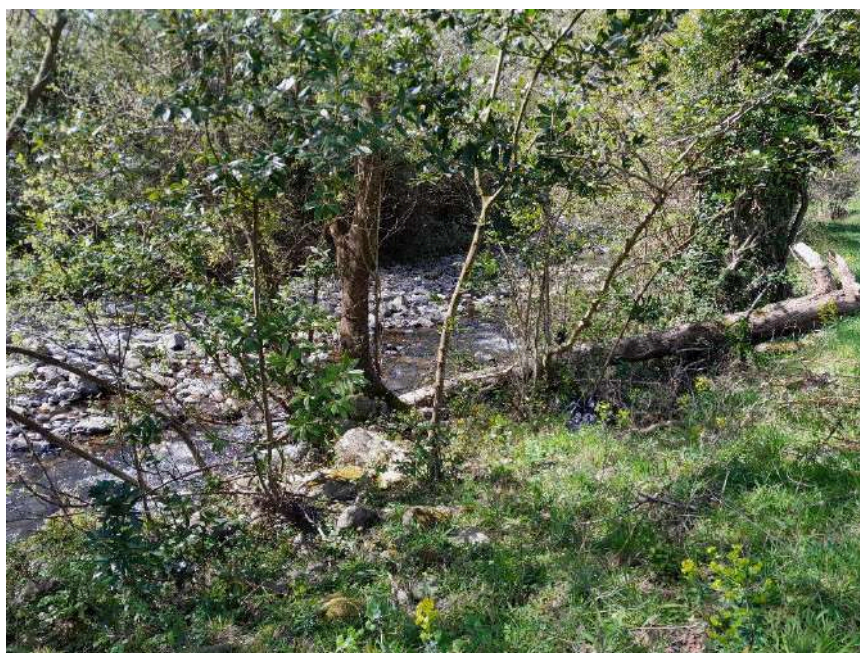
Árboles caídos en el cauce del río Gándara