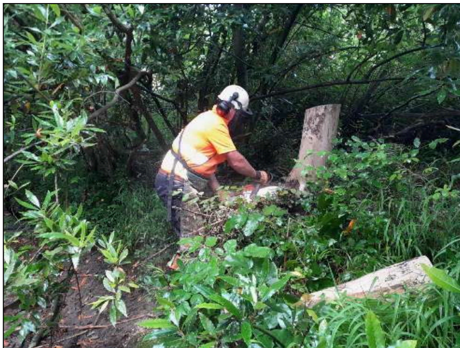
Trabajos con motosierra de retirada de árboles caídos