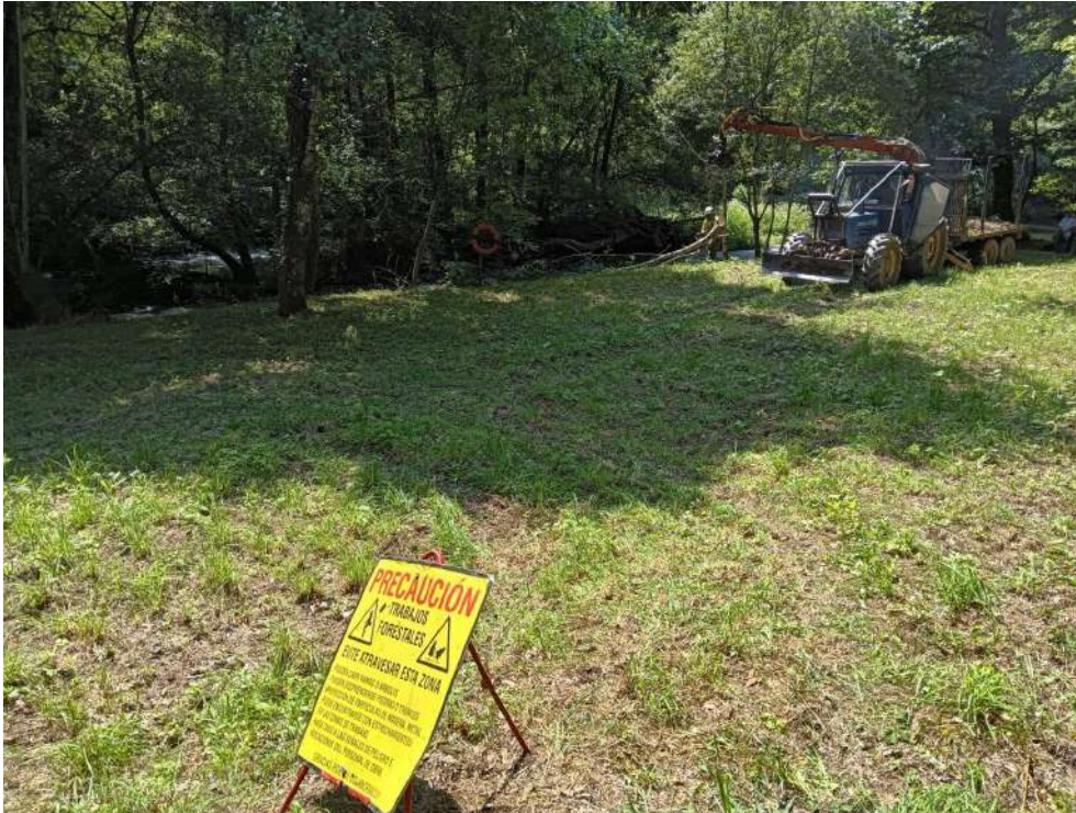
Operario y autocargador retirando restos vegetales