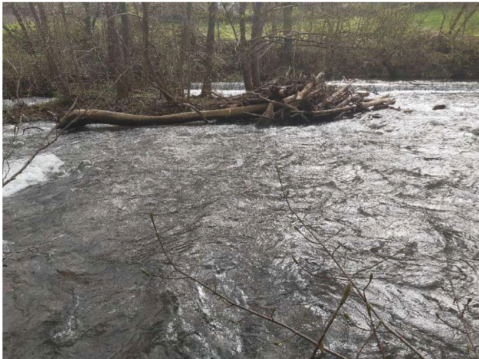
Antes de los trabajos