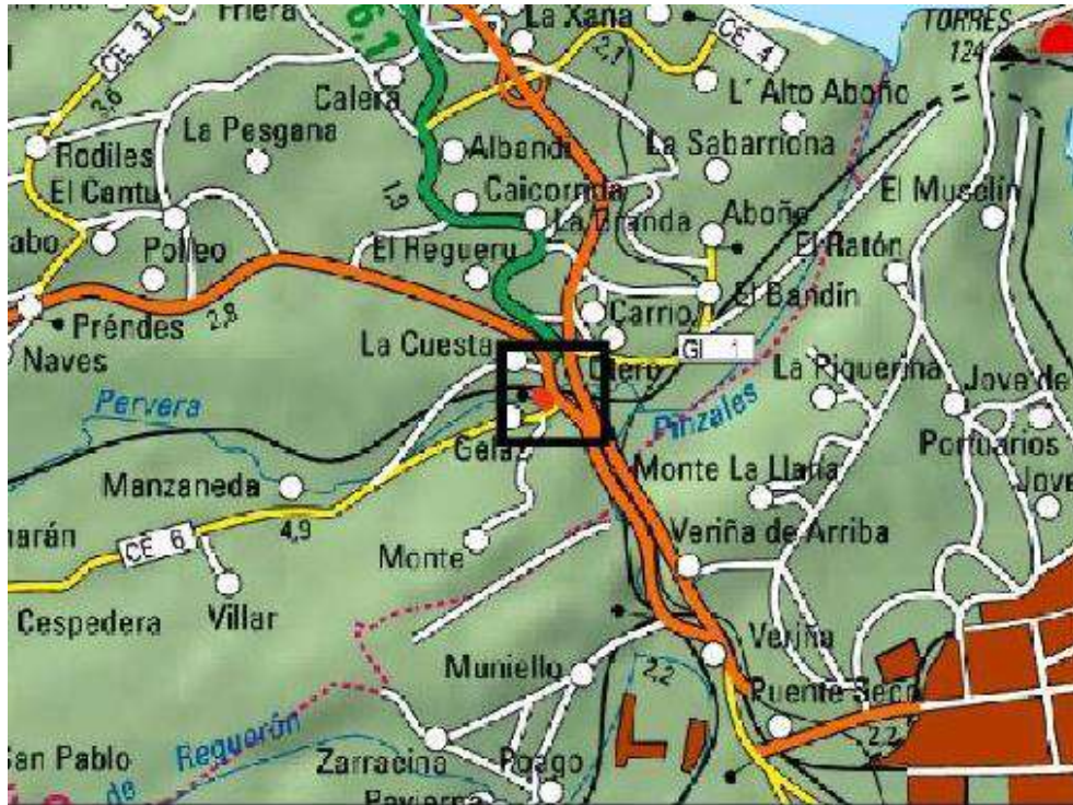
Localización de las actuaciones en el río Pervera en el barrio de Xelaz