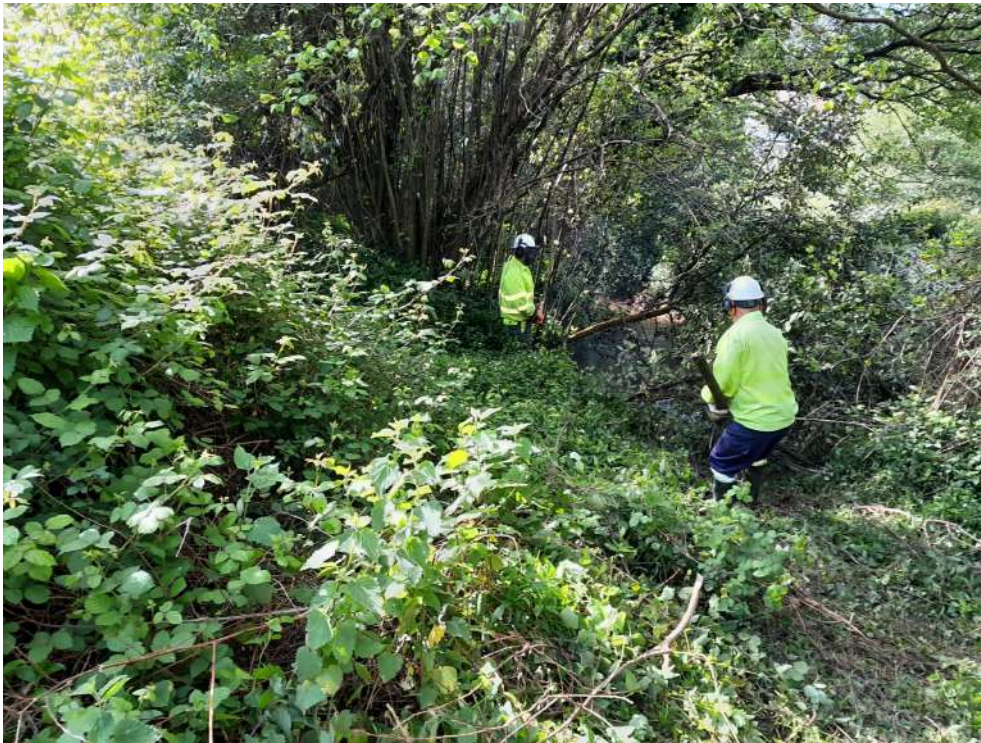
Durante los trabajos. Operarios retirando restos vegetales del cauce