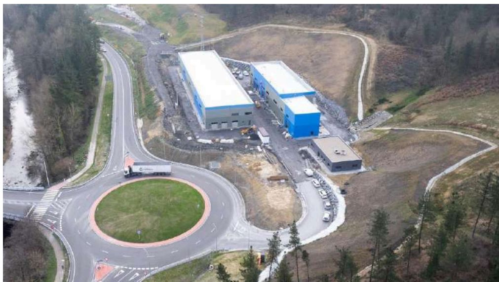
Estado de ejecución de los trabajos

En la actualidad, la glorieta se encuentra plenamente operativa y los tres edificios de la EDAR están contruidos, con la gran mayoría de equipos electromecánicos instalados. Las tareas pendientes incluyen la finalización de la urbanización de la parcela y las pruebas de funcionamiento.