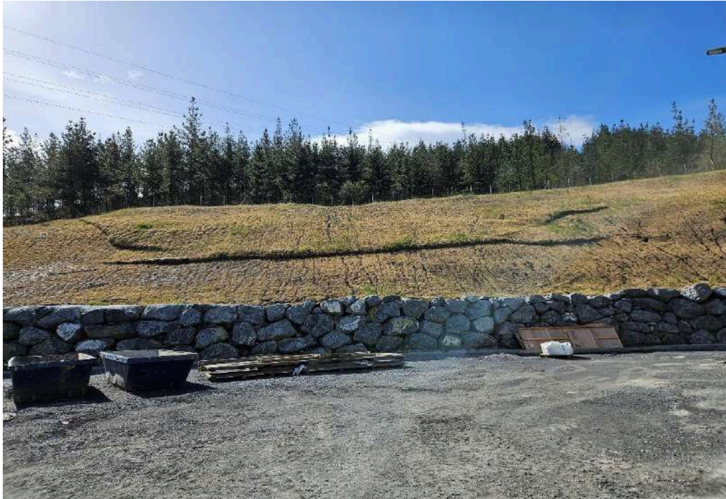
Detalle del estado del talud