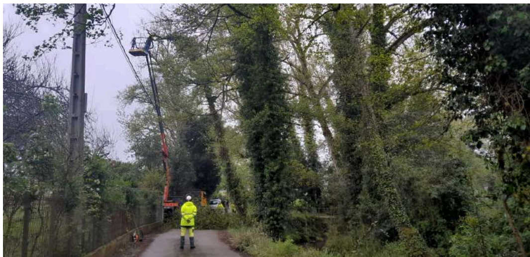
Durante los trabajos