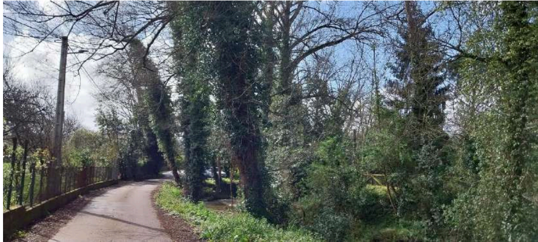
Antes de los trabajos