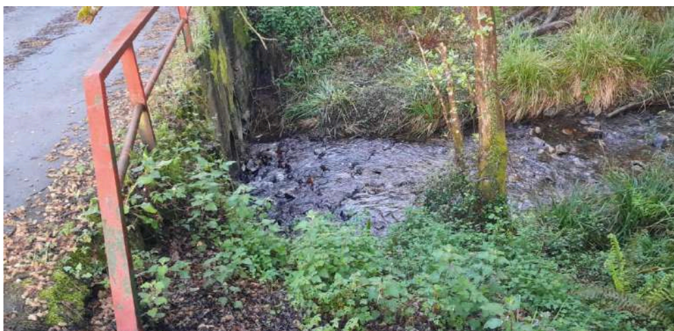
Después de los trabajos