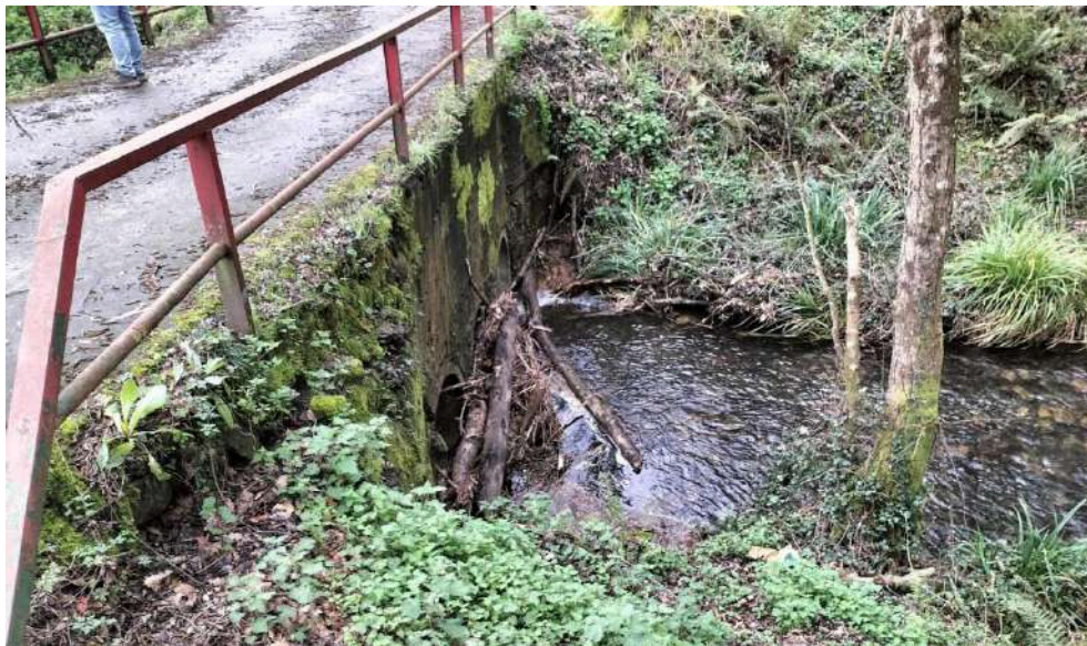
Tapón vegetal antes de los trabajos