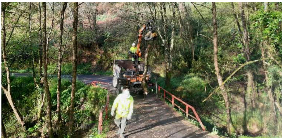
Autocargador retirando tapón vegetal durante los trabajos