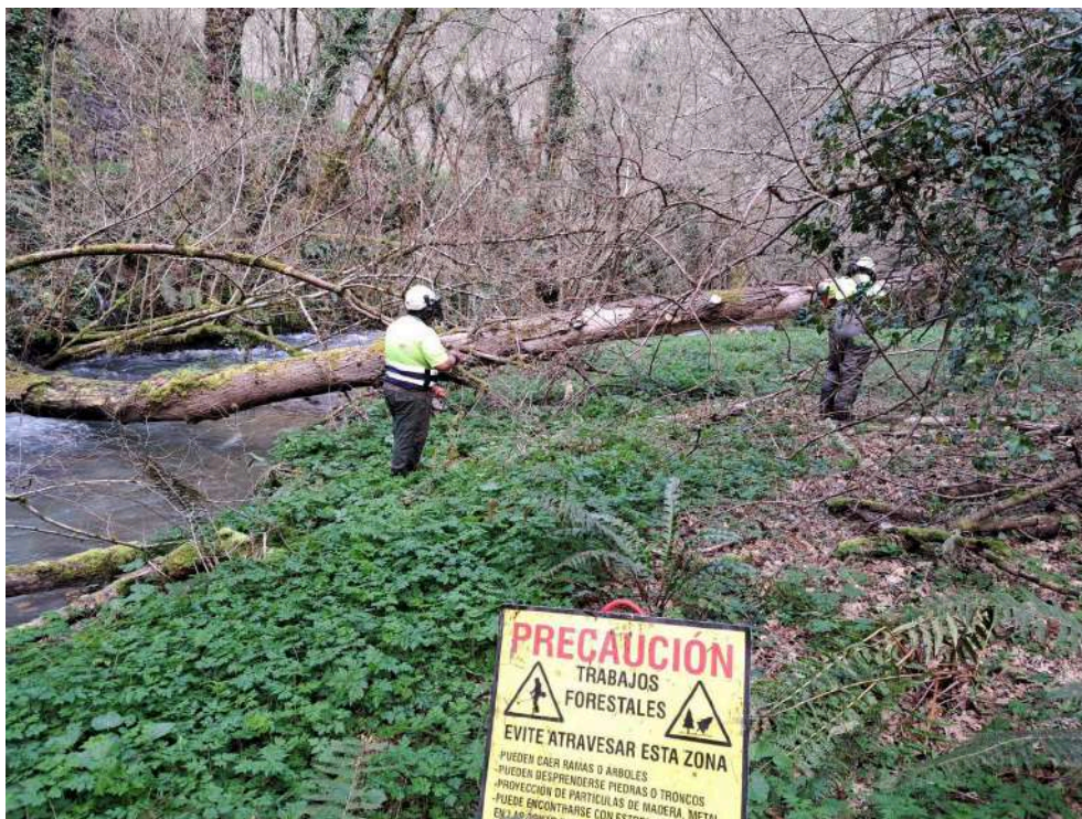
Operarios retirando restos vegetales