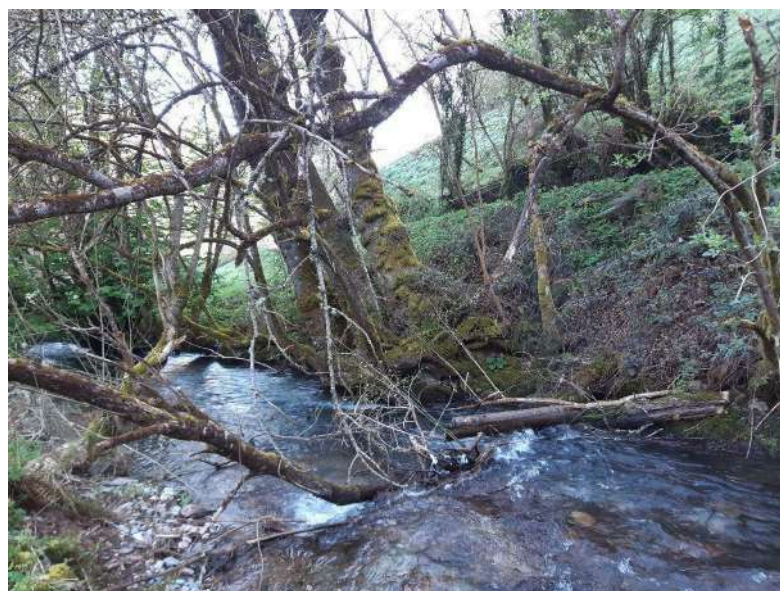
Antes de las actuaciones