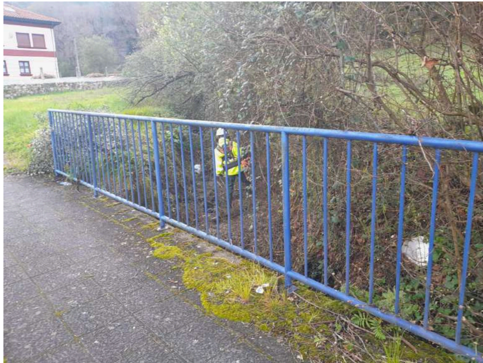
Operario desbrozando la vegetación que crece dentro del cauce