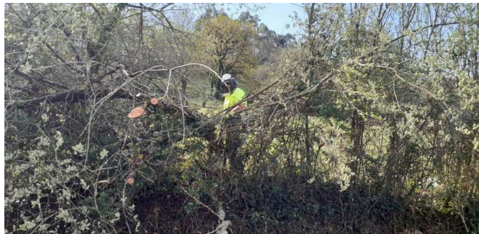
Operario eliminando vegetación que crece dentro del cauce