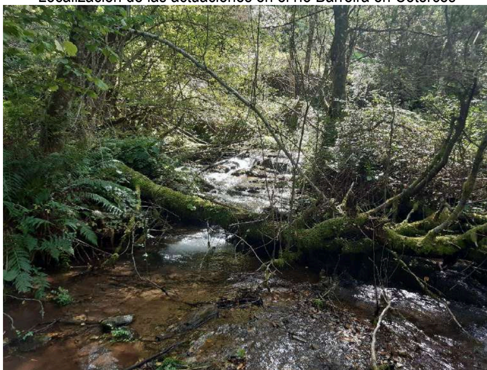
Antes de las actuaciones