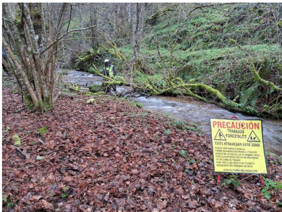
Operario retirando restos vegetales