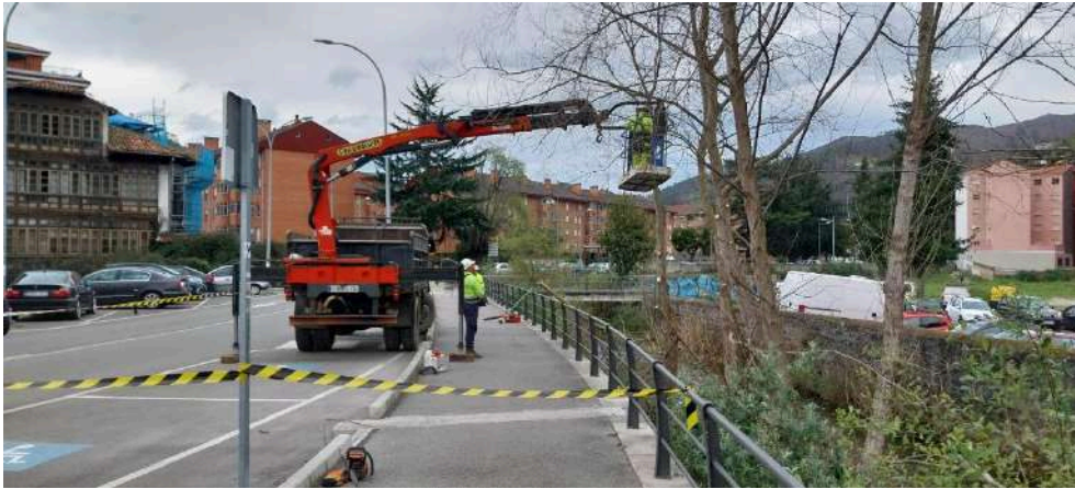
Operarios cortando un árbol desde la cesta