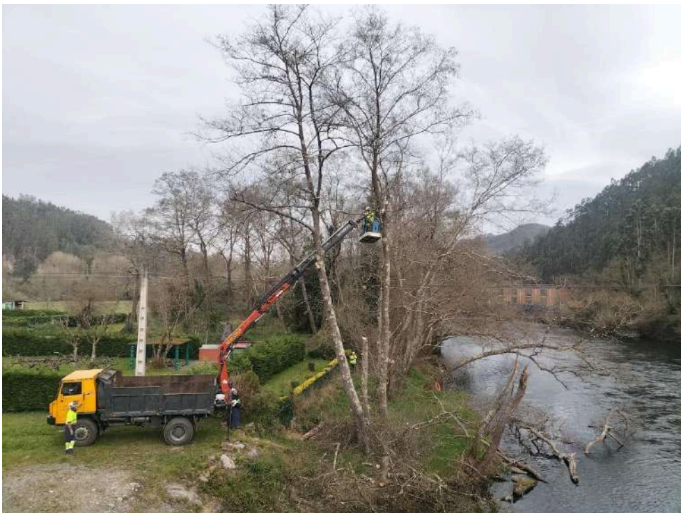
Durante los trabajos