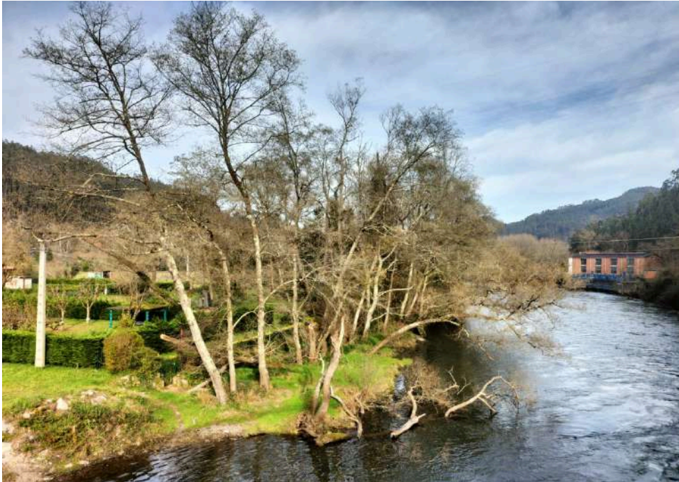
Antes de los trabajos