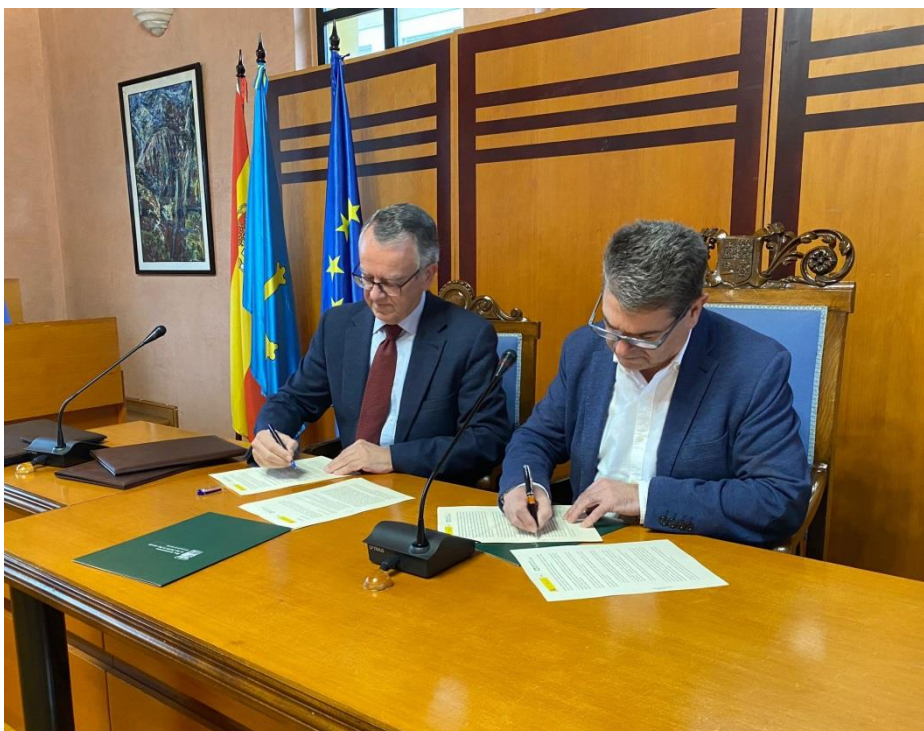
Firma del convenio