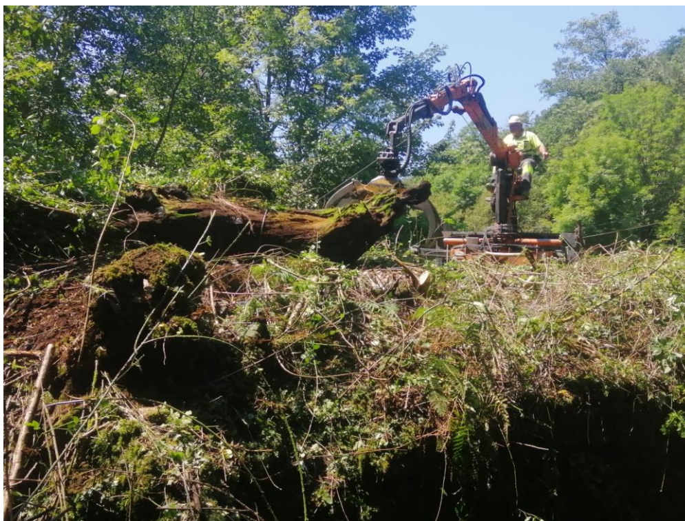
Trabajos de conservación y mantenimiento de cauces